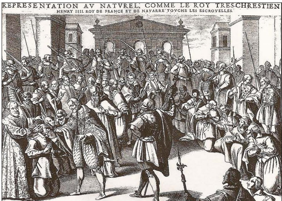
Figura 4. El rei Enric IV tocant les escròfules. Gravats del llibre Laurentis de strumis earum causis et curae d'André du Laurens (París, 1609).

Com a nou rei de França, un dels deures de Lluís XIII era la pràctica del “toc reial”, és a dir, tocar els malalts d'escròfules, que es congregaven en gran nombre per rebre la imposició de les mans del monarca. 52 Era una antiga creença que els reis de França i Anglaterra tenien el poder de guarir els escrofulosos simplement imposant-los les mans. Era una reafirmació del poder diví de la monarquia i de la legitimitat de la dinastia, 53 en demostrar que els reis eren els intermediaris entre Déu i els homes i que estaven dotats de poders taumàrgics (Figura 4). 54