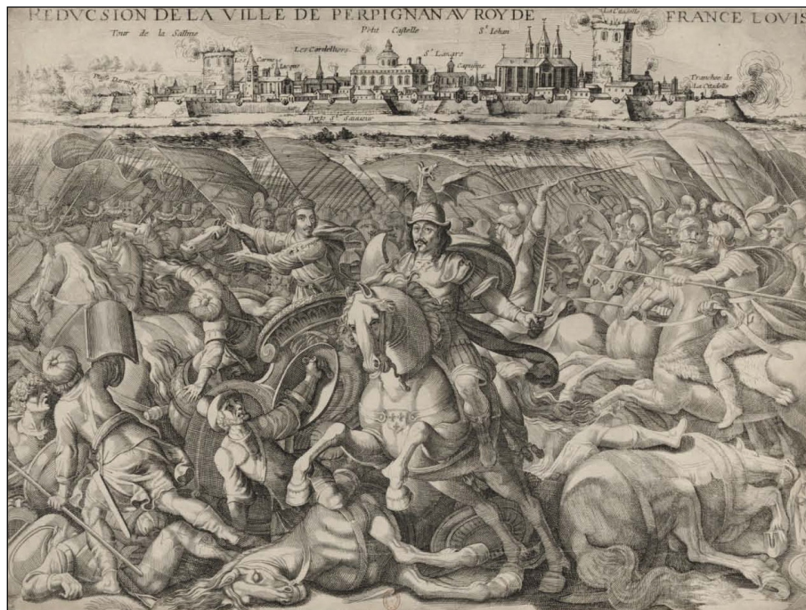
Figura 6. Gravat representant el setge de Perpinyà (1642). Bibliothèque Nationale Française.

Els tractaments que els metges reials van administrar al rei són impressionants. Des de 1628, el protometge del rei era Charles Bouvard (1572-1658), professor de la Facultat de Medicina de París des de 1605, i sobrintendent del Jardin royal des plantes médicinales. 78 En poc temps li va prescriure 212 enèmes, 215 medicines i 47 sagnies. 79 També li aplicaven bufetes de porc plenes de llet bullint sobre el ventre. 80