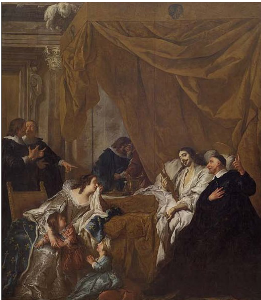
Figura 7. Jean-François de Troy: Sant Vicenç de Paül al llit de mort de Lluís XIII. (1731). Den Kongelige Malerisamling, Copenhague.

Disset hores més tard de la mort, es va practicar l'autòpsia al seu cadàver, com era habitual en els reis i per descartar un eventual enverinament. Disposem de diversos testimonis d'aquest fet. 81 Segons les dades necròpsiques, la causa de la mort va ser una peritonitis purulenta amb perforació còlica. 82 La cara externa del fetge de color vermell clar i com si haguès estat bullit. A dins l'estòmac, un cuc de mig peu de llarg, amb molts d'altres més petits flotant en un líquid fosc. El duodè era