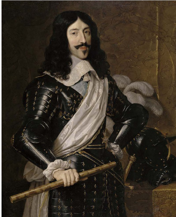
Figura 5. Philippe de Champagne: Lluís XIII, rei de França (1635). Museo del Prado. Madrid.

Tot i que als 4 anys d'edat (29 maig de 1605) va tenir un episodi diarreic aïllat, és poc valorable per la carència d'altra simptomatologia. 71 La primera crisi plena de la que tenim constància va tenir lloc l'octubre-novembre de 1616: va patir una crisi de vòmits i dolor abdominal, acompanyada de convulsions i lipotímia, que es va descriure com “un mal vapor dels intestins”. 72