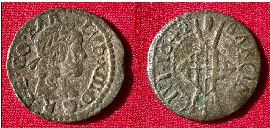
Figura 2. Moneda de sisè de velló, encunyat a la ciutat de Barcelona (1642). Anvers: Efigie de Lluís XIII i la llegenda: LVD·XIII·D·G·R·ET·CO·BAR (Ludovicus XIII, Dei gratia rex et comites Barcinoniensis). Revers: Escut de Barcelona i la inscripció BARCINO·CIVI·1642. (Col·lecció particular).

En aquest treball ens centrem en la figura de Lluís XIII, efímer i sovint oblidat com a comte de Barcelona, revisant les malalties que va patir al llarg de la seva vida, i especialment la que li va causar la mort. També considerem altres aspectes d'interès sanitari com la higiene, la terapèutica o algunes pràctiques de l'època, com la creença que el rei tenia el poder de guarir algunes malalties com les escròfules (una forma de tuberculosi cutània i ganglionar) tocant als malalts ritualment.