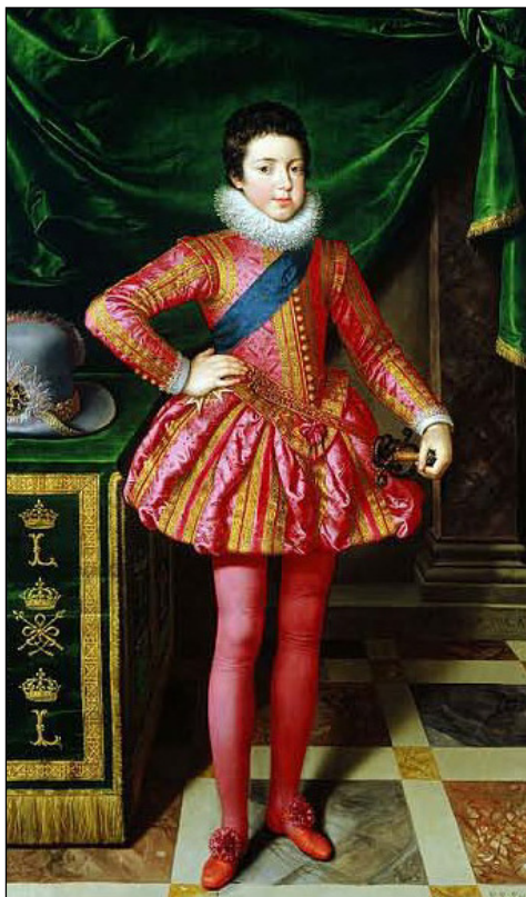
Figura 3. Frans Pourbus el Jove: Retrat de Lluís XIII, infant (1610). Palazzo Pitti. Florència.

A part de la quequesa, sembla ser que Lluís presentava una certa macroglòssia i un fre lingual curt, que li causava dificultats a la pronúncia. Sovint es mossegava la llengua. A finals de 1609, la reina proposa tallar-li el fre lingual per solucionar els seus problemes de dicció i el tartamudeig que, segons ella creia, també estava causat per un fre massa curt. 30