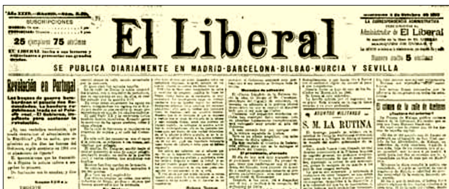
Figura 2. Capçalera del diari El Liberal.