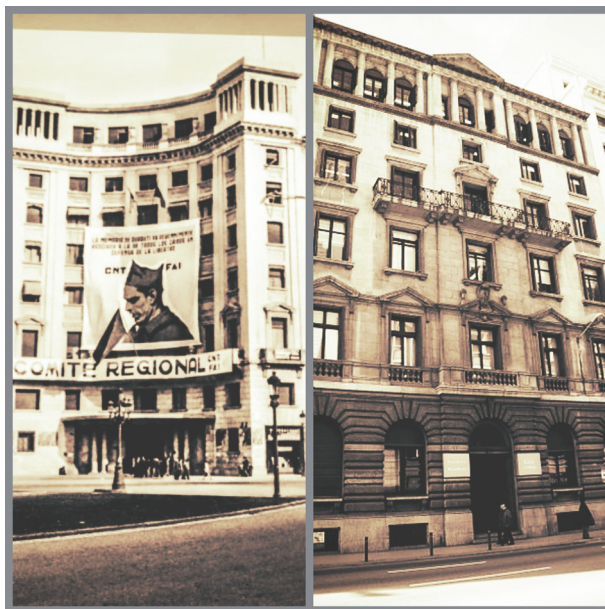
Figura 1. A l'esquerra la seu de la CNT, a la dreta l'edifici del Casal del Metge, tots dos situats a Via Laietana, Barcelona. (Foto: Fotomuntatge Ida Carrau).

Durant la Guerra Civil Espanyola, a Barcelona, entre el 3 i el 7 de maig de l'any 1937, es produïren diversos enfrontaments entre les forces d'ordre públic de la Generalitat de Catalunya juntament amb la complicitat dels milicians del PSUC (Partit Socialista Unificat de Catalunya), la UGT (Unió General de Treballadors) i l'Estat Català, davant l'hostilitat dels milicians de la CNT (Confederació Nacional del Treball), la FAI (Federació Anarquista Ibérica) i el POUM (Partit Obrer d'Unificació Marxista). Són els coneguts Fets de Maig. En aquells dies confusos, els incontrolats anarquistes, amb pretensions revolucionàries, i armats com anaven, aixecaren barricades i es tirotejaren contra les forces addictes al Govern. Aquests tres dies de lluita pels carrers de la capital comtal ocasionaren un vessament de sang amb un balanç d'uns cent cinquanta morts i més de quatre-cents ferits. Les sales dels hospitals de la ciutat, com l'Hospital General de Catalunya, l'Hospital Militar de Barcelona i la Creu Roja, entre d'altres, no donaren l'abast en atendre els ferits. El moviment, però, va fracassar i es va ordenar el desarmament d'aquests grups amb la recollida d'armes llargues i explosius. Molts d'aquests anomenats incontrolats van ser jutjats i enviats a la presó.