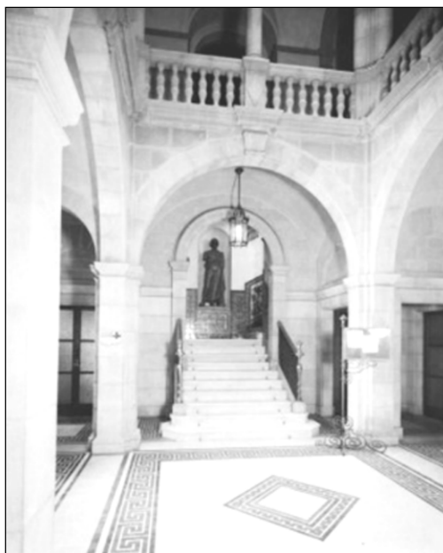
Figura 2. Escala d'accés interior al Casal del Metge. Al fons, l'escultura d'Asclepi o Esculapi, déu de la Medicina. 1932. (Foto: Imatge extreta de la web "Imatges d'Europeana Photography", < http://hdl.handle.net/10687/387289 >).

Durant aquests fets, el Casal del Metge, va ser ocupat pels anarquistes de la FAI. Aquest Casal s'havia inaugurat el 10 de desembre de l'any 1932 pel president de la Generalitat, el Molt Honorable Francesc Macià. El local social estava situat al carrer Via Laietana 31 / Tapineria 8-10, construït pels arquitectes Adolf Florensa i Ferrer i Enric Catà i Catà. En la mateixa seu del Casal del Metge, s'hi allotjava el Col·legi de Metges, l'Acadèmia de Ciències Mèdiques, l'Institut Mèdico-Farmacèutic, l'Associació de Metges i Biòlegs de Llengua Catalana, l'Acadèmia d'Higiene, la Mutual Mèdica, la Cooperativa de Consum del Sindicat de Metges, la Caixa de Crèdit, la Borsa de Treball i la Pensió i Residència per a metges i estudiants. Totes aquestes entitats mèdiques van fer possible, gràcies a les seves aportacions econòmiques, la construcció d'aquest Casal. Entre altres activitats, es proporcionava socors mutu als metges associats en els casos d'invalidesa i defunció, així com el pagament dels subsidis a vídues, orfes i companys necessitats. L'edifici, amb un soterrani, planta baixa i cinc plantes més, disposava de diverses dependències, com ara la Biblioteca, el Laboratori, la Sala de Conferències, la Secció d'Electromedicina i raigs X i la Secció de Mobiliari Quirúrgic (a la planta baixa), oficines (als nivells superiors) i Pensió i Residència (a les plantes quarta i cinquena).