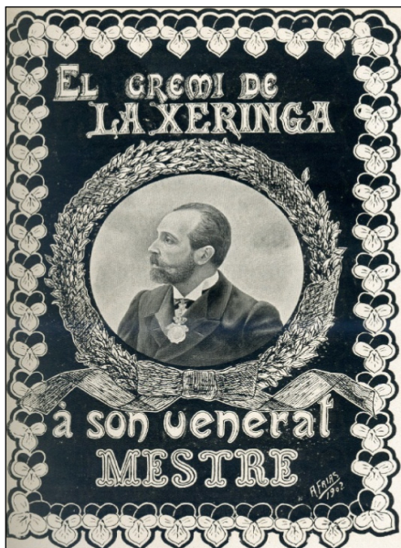
Figura 8. Cartell de reconeixement dels membres de La Xeringa al Dr. Robert al cap de poc temps de la seva mort.