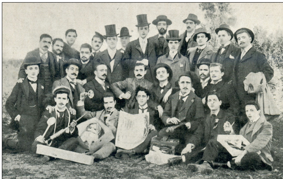
Figura 3. Participants en el II Certamen Humorístic de La Xeringa, l'any 1900