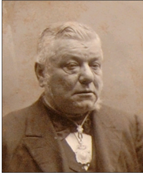
Figura 6. El catedràtic Joan Giné i Partagàs