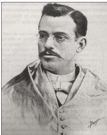
Figura 4. Odón de Buen y del Cos, el 1889