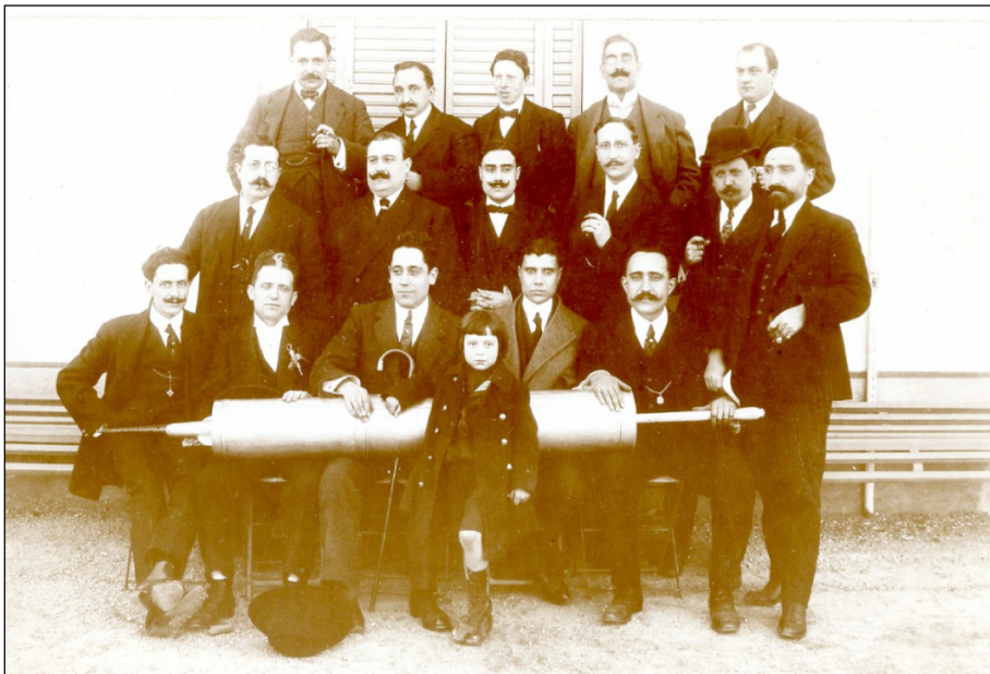
Figura 2. Reunió de La Xeringa, l'any 1910