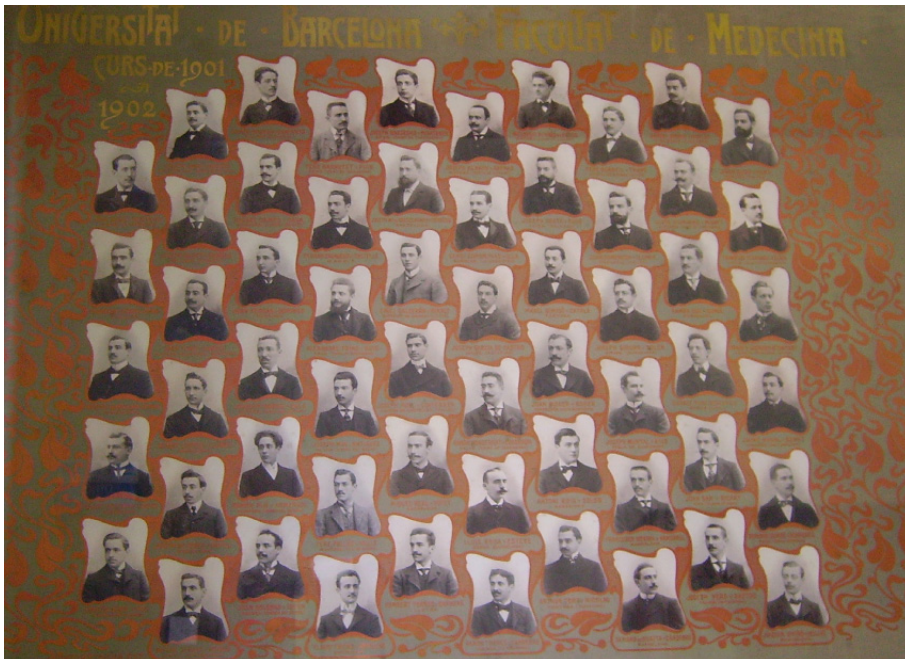
Figura 7. Orla de la promoció del grup La Xeringa