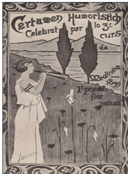
Figura 9. Cartell anunciador del I Certamen Humorístic de La Xeringa