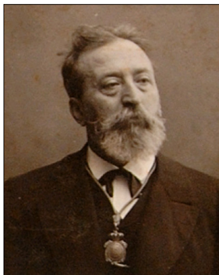
Figura 5. El catedràtic Josep Antoni Massó i Llorens