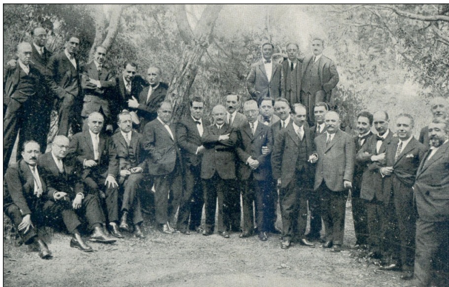
Figura 10. Els participants a les reunions del Dijous Gras, el 1927