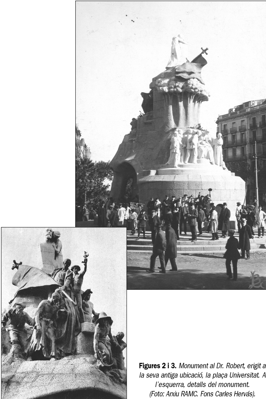
Figures 2 i 3. Monument al Dr. Robert, erigit a la seva antiga ubicació, la plaça Universitat. A l'esquerra, detalls del monument.