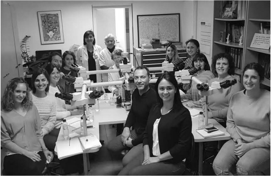
Figura 5. Alumnes observant cèl·lules en un microscopi de capçals múltiples.