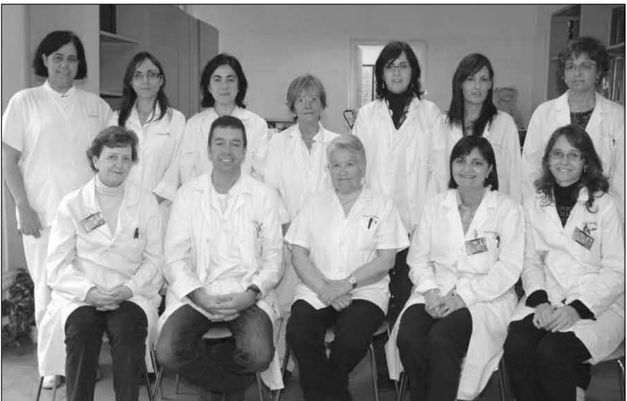
Figura 6. Equip docent, tècnics de laboratori i de secretaria de l'Escola de Citologia.