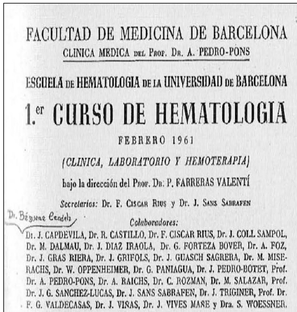
Figura 1. Cartell anunciador del Primer curs d'Hematologia de l'Escola de Hematologia de la Universitat de Barcelona", de l'Hospital Clínic (1961).