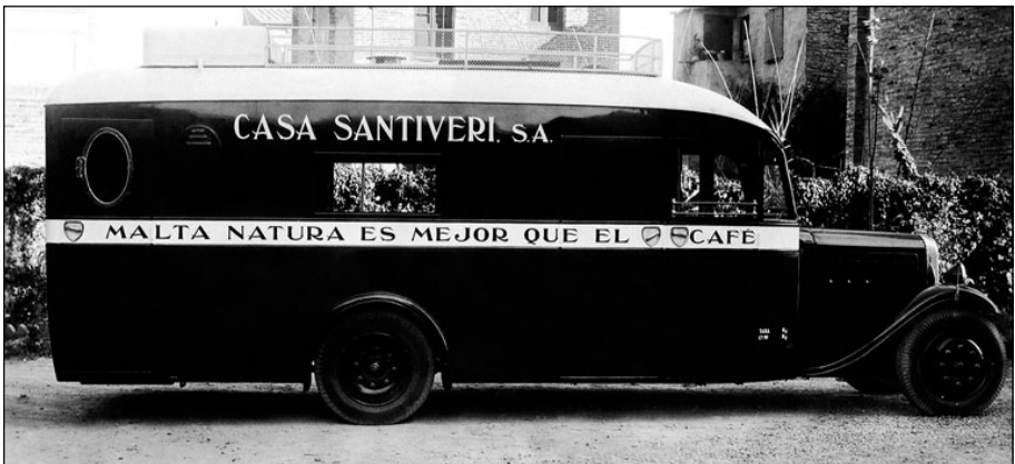
Figura 3. El 1930, Santiveri ja disposa d'un cotxe-degustació de malta amb el què recorria tot el país per promocionar aquesta beguda succedani del cafè, molt popular a la pre-guerra espanyola. De ment oberta i empenedora, el fundador de Santiveri, sempre va destacar per l'ús de tècniques de màrqueting atrevides i innovadores.