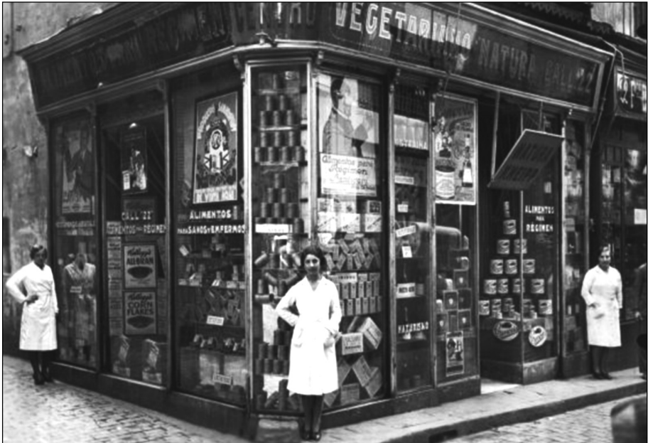
Figura 2. En aquesta botiga, situada situada al carrer del Call de Barcelona, va començar la història de Santiveri, el 1885, donant origen a la primera empresa de dietètica i productes naturals d'Espanya. La foto data de 1930. Aquesta botiga va estar oberta fins a l'any 2010.