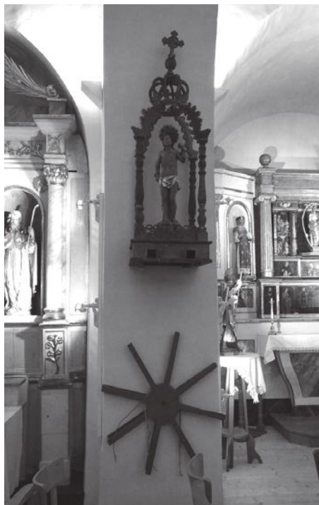
La roda en el camí d'anada i ja dins de l'esglèsia