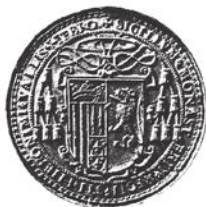
Escut i segell del monestir de Sant Jeroni de la Vall d'Hebron.