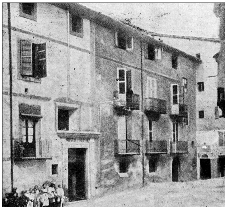
Façana de l'antic hospital de Sant Bernabé de Berga, cap a principis del segle XX.