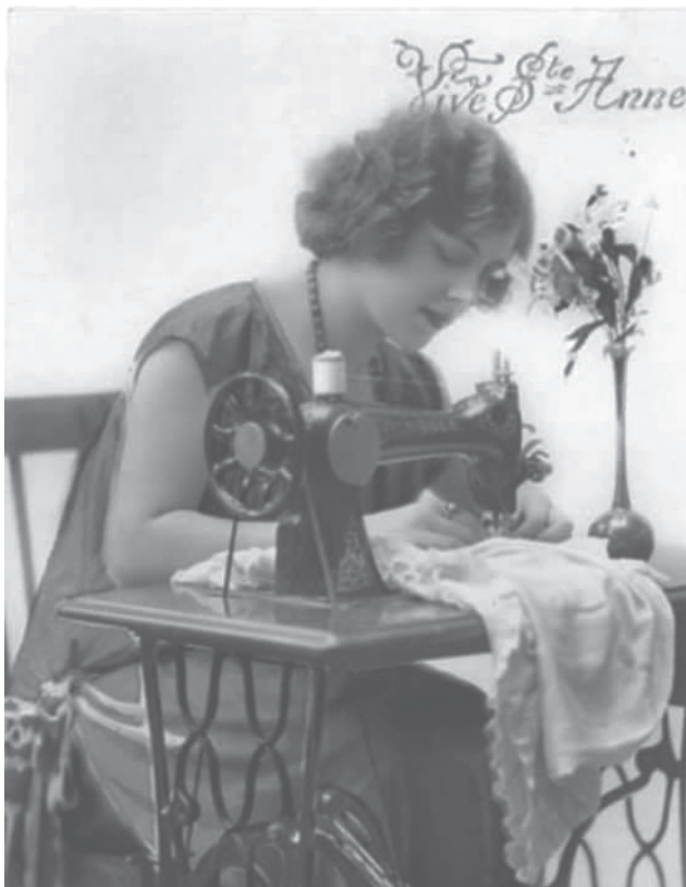
L'autoconfecció de roba ha estat durant milers d'anys la manera d'aconseguir vestir-se. L'aparició, el segle XIX, de la màquina de cosir va significar un gran avenç en aquest sentit.