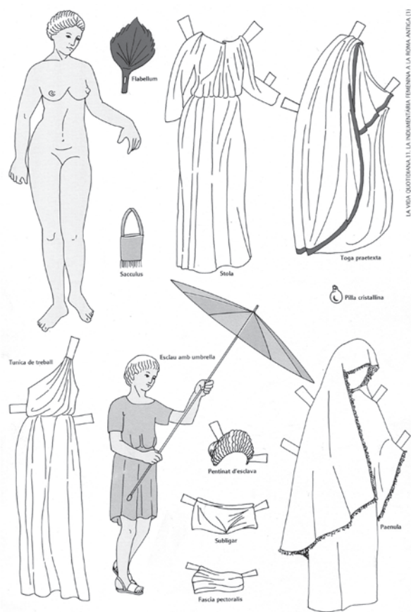
Retallable dissenyat per al seu ús didàctic al Museu Arqueològic de Barcelona.

També espais patrimonials que recuperen les formes de vida en entorns rurals dels segles XVIII al XIX, a més de mostrar col·leccions de vestits de treball o de festa tradicionals catalans, han elaborat materials en forma de retallables per vestir i desvestir hereus i pubilles. Un exemple d'això el tenim a Can Coll. 8