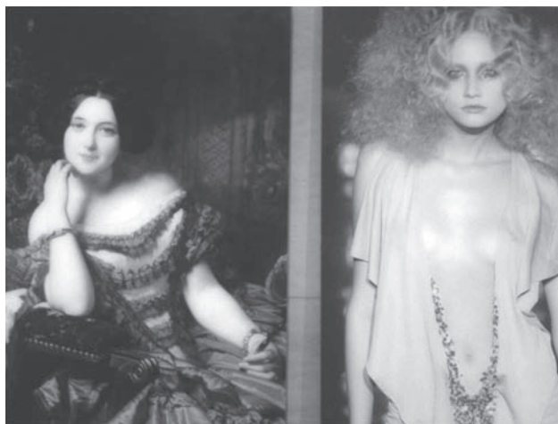
Dues noies, dos models de bellesa separats per dos-cents anys d'història.

cos per estar prim, musculats, sans i atractius, tot seguint el model dels més joves. La cirurgia estètica, les dietes i l'esport exagerat provoquen modificacions profundes del cos, que està sotmès a les mateixes exigències de la moda.