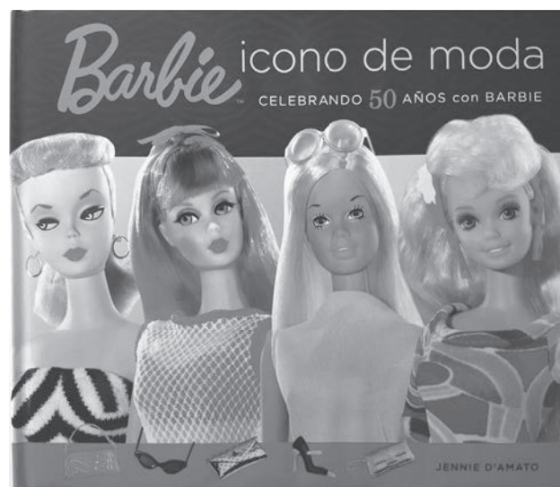
Llibre sobre moda i Barbie amb motiu del 50è aniversari de la nina.

Nancy i Lucas, Barbie i Kent, parelles dona/home en nines de gran difusió infantil. En el marc del joc simbòlic com a estratègia d'aprenentatge amb