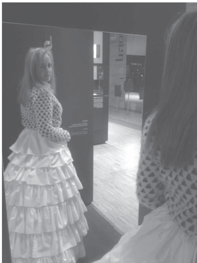
Vestint-se amb models antics al Museo del Traje de Madrid. Interacció en la divulgació.