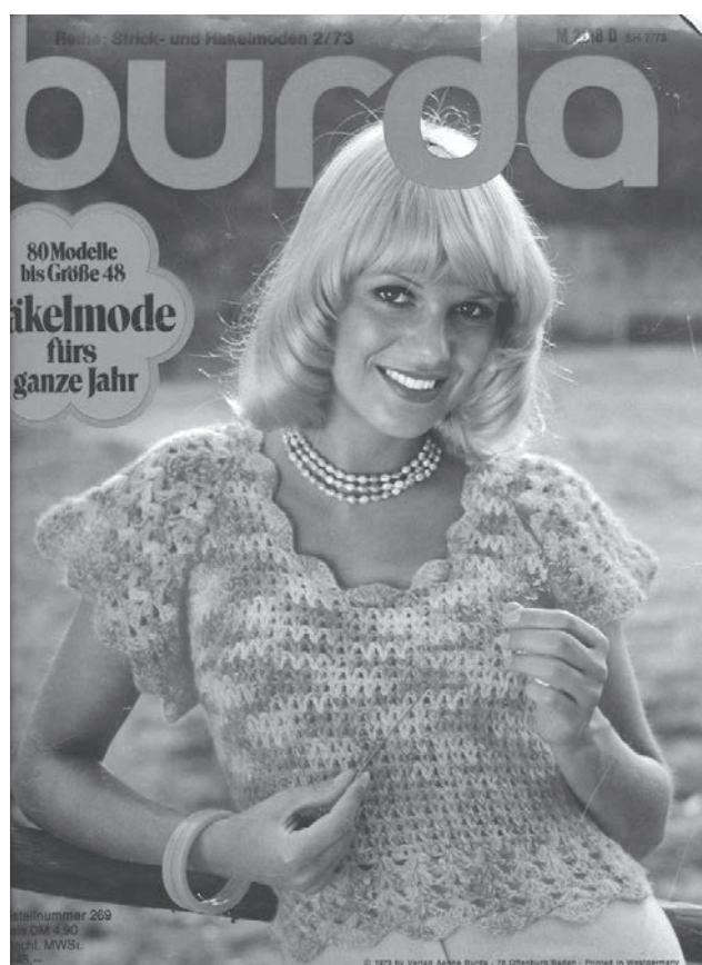
Portada de la revista Burda de l'any 1973.

Però la tradició de les revistes de moda a Catalunya venia dels anys 1920 amb La Dona Catalana . De fet, es va començar a publicar l'any 1925. Era una revista dirigida a les dones, especialment a les dones que la revista definia com a independents, xics i sofisticades. Pretenia emular altres revistes femenines, com l'americana Vogue , que també s'editava en francès. 7 El gener del 1939, amb l'entrada de les tropes franquistes a Barcelona, va ser prohibida pel fet de ser publicada en català.