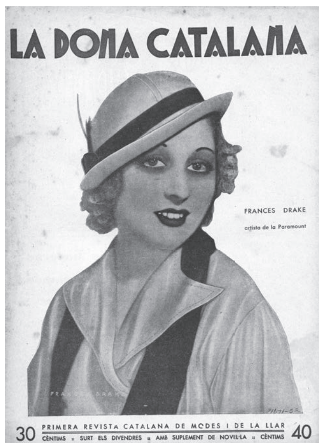
Portada de la revista La Dona Catalana dels anys 1930.

Ja veiem com el treball amb aquest tipus de revistes pot donar peu a parlar de la moda des d'una perspectiva històrica i sociològica.