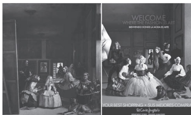
La pintura i la moda dins de la publicitat i la moda en aquest exemple del Corte Inglés.

Si bé la pintura i l'escultura tenen les evidents limitacions de no permetre tocar els teixits o veure les robes més interiors de les persones, sí que és cert que el seu potencial educatiu en el tema que tractem és incontestable. La història de l'art és plena d'obres que ens mostren l'evolució del vestir al llarg del temps. Si bé habitualment de les classes altes (aquelles que podien permetre's pagar un artista per fer-se un retrat), també de vegades de les classes populars. Artistes com Brueghel el Vell, Velázquez, Vermeer o Murillo, entre d'altres, van plasmar als seus llenços el vestir de les classes més populars del seu moment històric, amb un detall extraordinari en el referent a la seva manera de vestir.