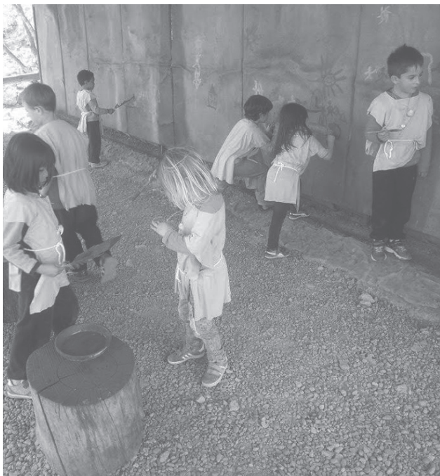
Grup de nens i nenes pintant "a la prehistòria", una vegada vestits com a prehistòrics.