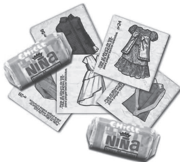
Alguns productes dirigits al públic infantil, com és el cas de Chicles Nina, també van posar al mercat una col·lecció de cromos vinculada al vestir en l'embotcall del xiclet.

Si bé l'auge de les col·leccions de cromos podem situar-lo entre els anys seixanta i vuitanta del segle XX (era especialment esperat el diumenge al matí per anar a canviar o a comprar els cromos que ens faltaven per acabar la col·lecció), és ben cert que encara és possible adquirir-ne en fires de vell, o al propi mercat de Sant Antoni de Barcelona. Algunes col·leccions proposaven endinsar-se en el món dels vestits tradicionals al món, d'altres a l'abillament militar i d'altres al vestir en el temps.