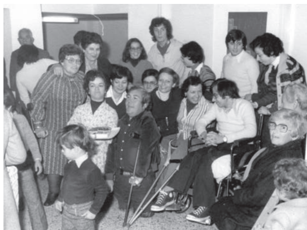
Foto 8: 1975, Inauguració del nou local de Casa Vostra i Nostra, al semi-soterrani de l'edifici de Correus.