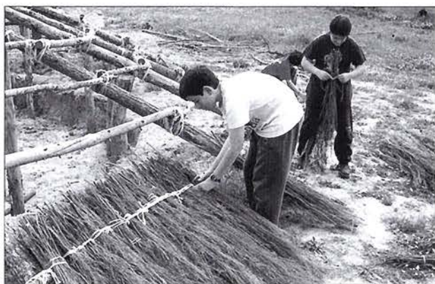
Reconstrucció d'una cabana neolítica a l'IES Sant Quirze

Els seus objectius didàctics van consistir a apropar les noies i els nois europeus als processos històrics que abocaren a les dones i als homes del passat prehistòric del nostre continent a adoptar una economia productora agrícola i ramadera, i donar a conèixer els elements més característics de la seva vida quotidiana. Aquests objectius es desenvolupen a partir de tres exemples del patrimoni històric local dels quatre centres associats: el jaciment arqueològic de la Bòbila Madurell (Catalunya), el conjunt megalític de Carnac (Bretanya) i les restes arqueològiques d'Avebury (Anglaterra).