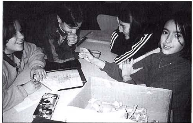
Taller de paleontologia

Tots els tallers mòbils s'estructuren al voltant d'un conjunt d'objectes replicats, materials orgànics i instruments d'observació, de mesura i classificació, mitjançant els quals s'introdueix el tema de cada taller i es desenvolupa una activitat d'experimentació o de recerca. Tots els tallers compten amb propostes de treball per abans i després de l'activitat i materials de suport per al professorat i l'alumnat. Els tallers mòbils estan dividits en dos àmbits generals: d'una banda, els de simulació i experimentació i, de l'altra, la introducció al mètode arqueològic. La mul-