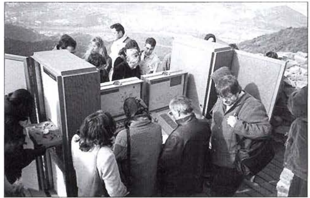
Visita al jaciment de Puig Castellar a Santa Coloma de Gramenet en el marc del III Seminari d'Arqueologia i Ensenyament (novembre del 2000)

El propòsit d'aquests seminaris és assolir un àmbit d'abast internacional i interdisciplinari (arqueologia, antropologia, pedagogia, museologia, gestió cultural, etc.) i, en conseqüència, reunir els professionals més diversos. El primer seminari, celebrat el 1996, va dedicar-se a les experiències relacionades amb l'ensenyament de l'arqueologia en els nivells educatius preuniversitaris, dins el context de la nova realitat educativa derivada de l'aplicació a l'Estat espanyol de la LOGSE. El segon seminari, el 1998, va centrar-se en les estratègies de divulgació a partir de l'experimentació i la reconstrucció empàtica en parcs arqueològics. Durant el tercer seminari, l'any 2000, es va fer un repàs de diferents projectes educatius en tots els nivells d'ensenyament reglat des d'una perspectiva comparativa de la realitat europea. El tema del quart seminari, celebrat el passat mes de novembre, va ser la funció social dels museus i les seves estratègies educatives; la reflexió es va dur a terme a