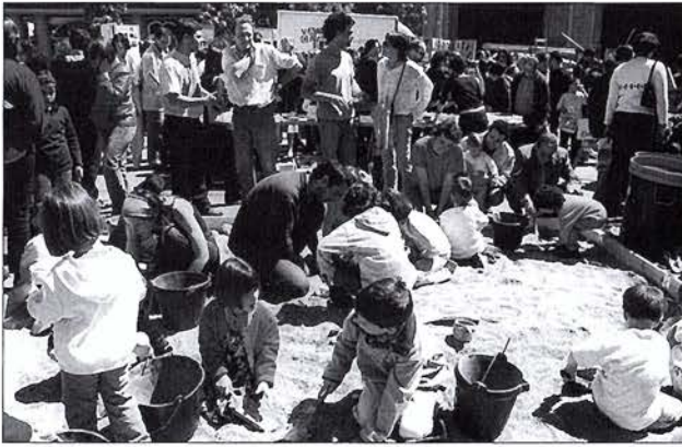
“Arqueòlegs” en plena excavació a la plaça de la Font Vella de Terrassa (maig del 2002)