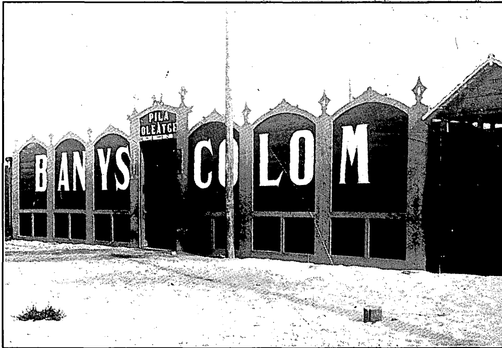
Banyes d'en Colom.