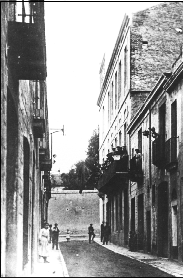
La casa del poble, local social on es reunien els sindicalistes de la UGT i els socialistes. Situada al carrer de Santa Marta (al fons s'aprecia la muralla del convent de les Tereses), va ser de les primeres seus sindicals de Catalunya. Inicis del segle XX.

militar, fou suspesa la sessió que el dimecres s'havia de celebrar a l'Ajuntament. La Creu Roja, des del primer dia, oferí els seus serveis a l'alcaldia pel que pogués succeir i, en proclamar-se l'estat de guerra, es posà a disposició de l'autoritat militar.