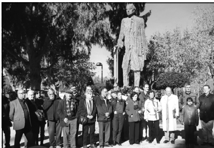
Assistents a l'ofrena floral del 22 de desembre al Parc Central.