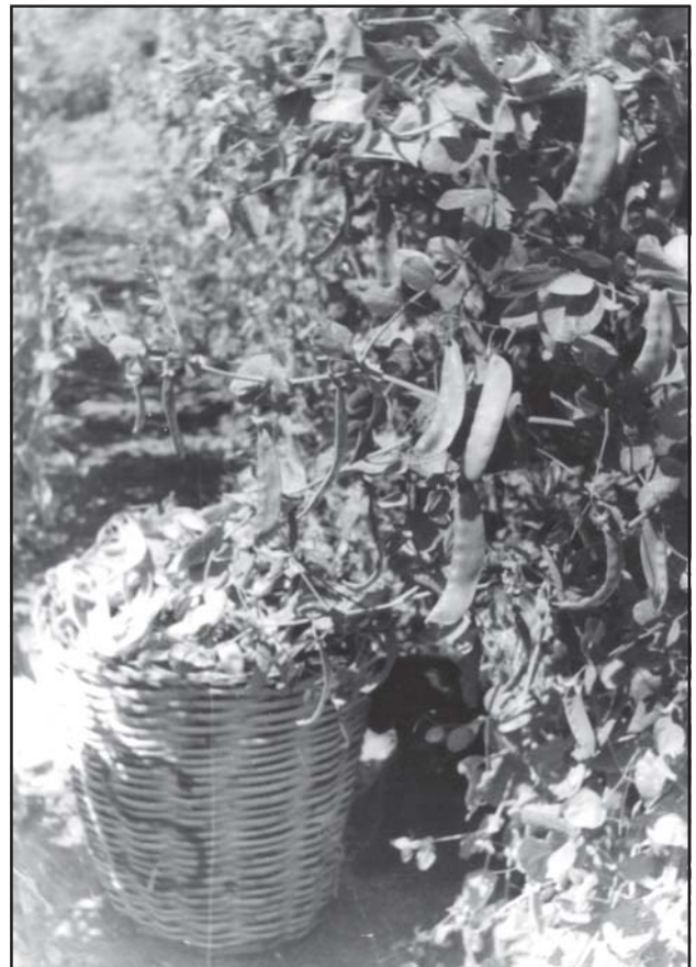
Cove amb pèsols indians (1964)

En Josep Majó importava la llavor de la varietat Royal Kidney, i la repartia als seus clients des de Masnou fins a Malgrat, entre els mesos d'octubre i de novembre, i els comprava la collita per l'abril o el maig.