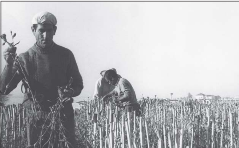
Collint clavells (1972)

Hi havia unes colles especialitzades, que generalment eren de gitanos, que es contractaven per cosir coves o sacs a tant la peça.