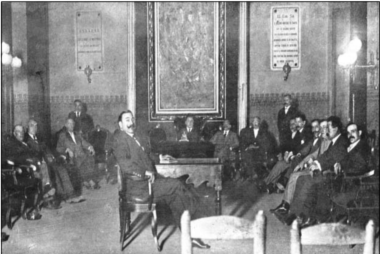
L'Ajuntament de Mataró, al final d'una sessió.

Revista Pequeña Gaceta del régimen local (1917)