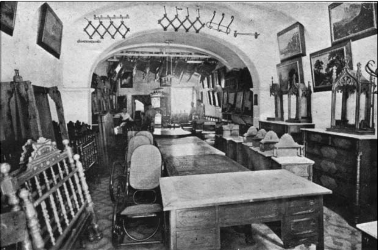
Mobles Ros, Bergel i Forns, carrer de Barcelona.