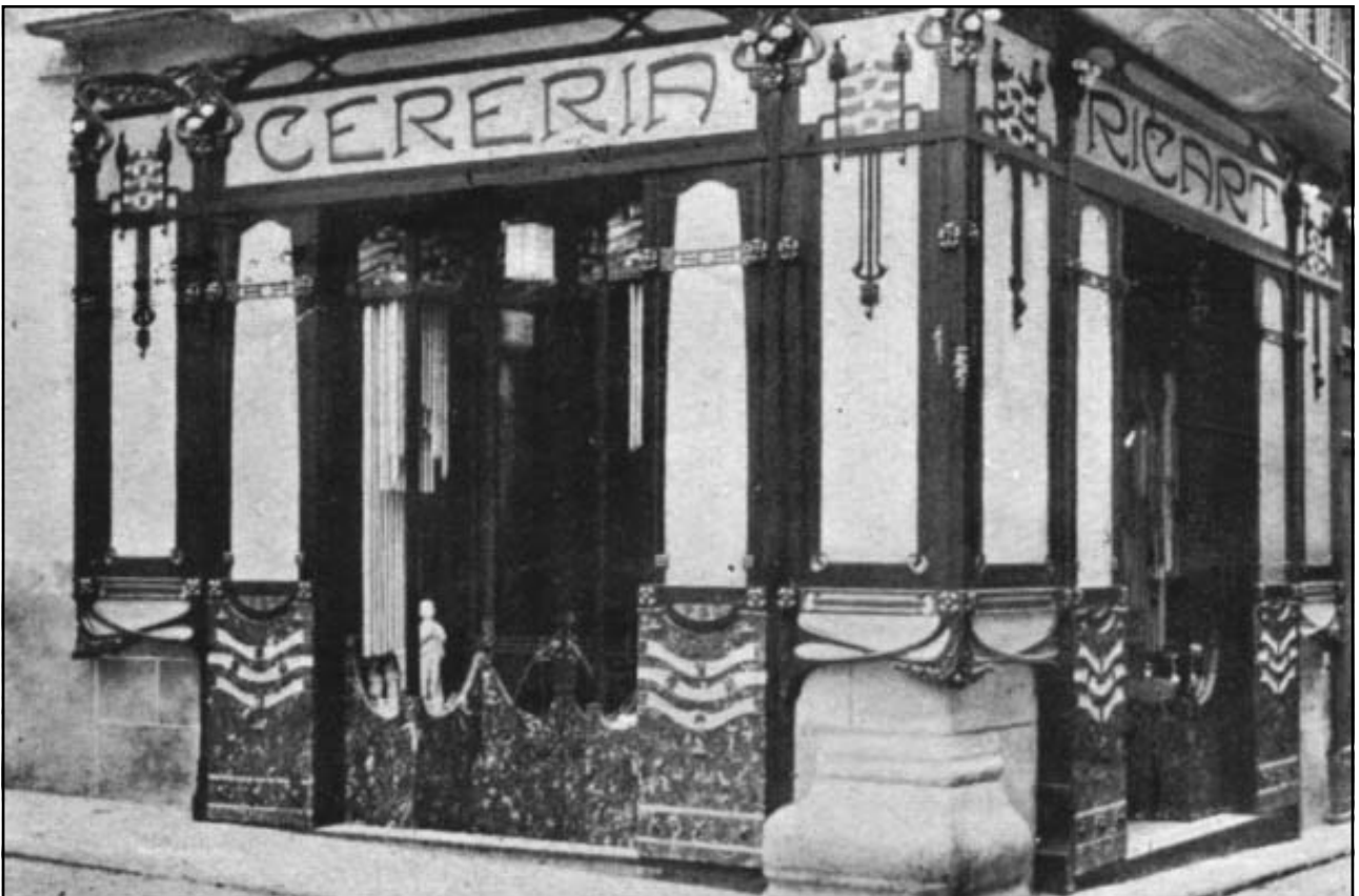
Cereria Ricart. Carrer de Beata Maria, cantonada carrer de Santa Maria.

Revista Pequeña Gaceta del régimen local (1917)