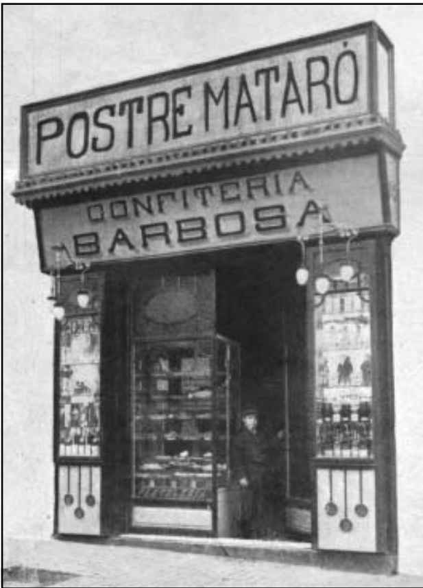
Confiteria Barbosa. Carrer de Santa Teresa, núm. 48 Revista Pequeña Gaceta del régimen local (1917)