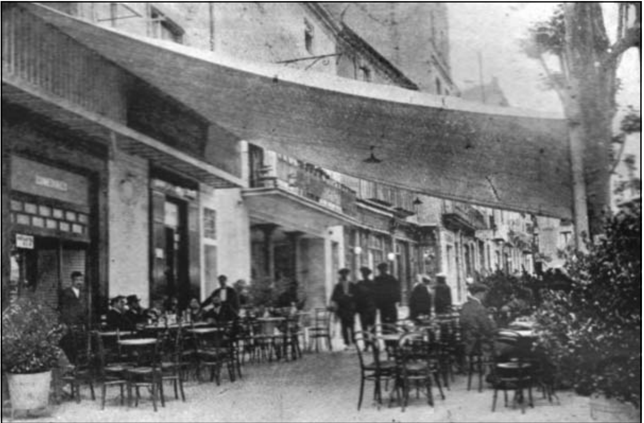
Cafè de ca l'Aragonés. La Riera, núm. 71 (abans, 32)

Revista Pequeña Gaceta del régimen local (1917)