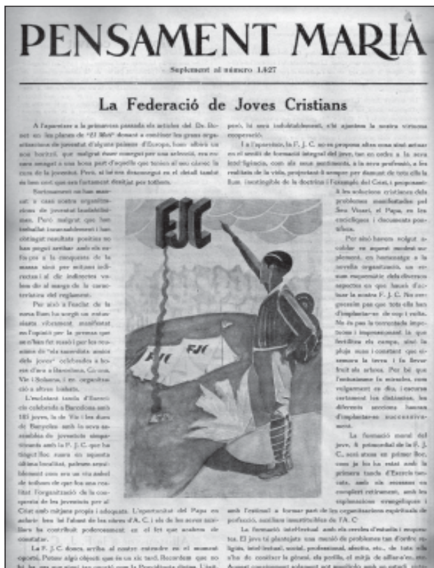
Capçalera del suplement de bisetmanari Pensament Marià dedicat a la Federació de Joves Cristians de Catalunya.