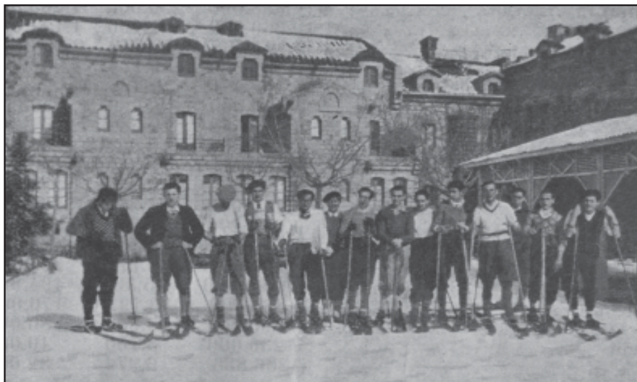
Socis del grup Lleó XIII de Mataró a punt per esquiar a Santa Fe del Montseny. Flama , 5 febrer 1932.

Flama informa el 5 de febrer de 1932, que el grup Lleó XIII, «compta ja amb una quarantena de joves» i dona compte de les activitats excursionistes i teatrals. El 15 d'abril en l'apartat de divulgació de les activitats dels grups a pobles i comarques, s'hi insereix una fotografia amb catorze joves calçant esquís, indicant que són «Socis del Grup Lleó XIII de Mataró a punt d'esquiar a Sta. Fe del Montseny». 14 L'esport responia perfectament a la formació del jove per a la recerca de l'equilibri físic i l'espiritual, una activitat imprescindible i necessària; es programaven sortides, acampades i concursos atlètics, i actuava, a més, d'element cohesionador per ser analitzat pels mateixos fejecistes. El grup Joventut va organitzar un cicle de conferències sobre temes religiosos, socials, artístics, patriòtics i esportius; el 28 de febrer de 1933 l'esportman fejecista del grup Joventut, en Josep M. Soler i Vilà, parlà de «L'esport eficaç col·laborador de la formació integral del jove cristià».