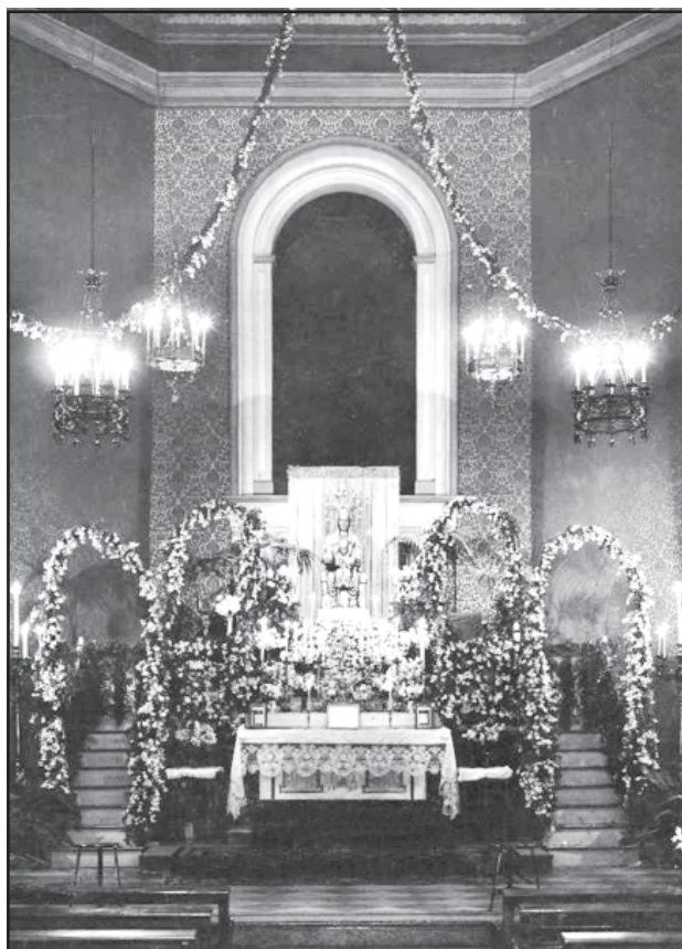
Altar major de l'església de Santa Anna. Muntatge pel Quinari del 1941.