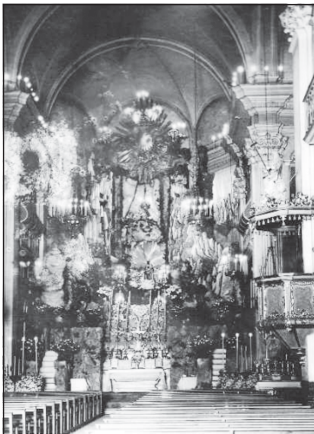
Altar major de l'església de Santa Anna. Muntatge pel Quinari del 1936.

Un dels records que encara perdura en moltes persones és el gran decorat que es muntava en el presbiteri del temple per a la novena del mes d'abril dels quinaris. Creiem que el primer d'aquests muntatges va ser el 1916 segons una fotografia que es conserva. Del de 1921, en tenim a més de la fotografia l'explicació que en deixà un escolar de l'època 9 . Diu que es conservà la part del monument de Setmana Santa que servia per a col·locar-hi l'urna amb el Santíssim i les escales laterals per a pujar-hi. La resta de guarniment va substituir-se per «tableros, -continua el testimoni- representaciones de los picos más populares de la Santa Montaña, grandes fajos de "mata", el arbusto más popular de nuestra serranía, cuya aroma me recordaba el olor tan típico que exhalan nuestros caseros pesebres, todo en fin se amontonaba en nuestra sacristía para pasar luego a adornar la monumental montaña que con gran lujo de detalles se iba formando en el presbiterio.» La imatge «estaba asentada -segueix el nostre cronista- en un zócalo sobre unos rieles, y en un momento dado, por medio de un cable, se hacía descender lentamente la sagrada imagen hasta el rellano de la escalera para recibir allí el ósculo de amor de los fieles». El germà Gregori González i Hernández 10 , responsable i agent d'aquest muntatge, hi afegia uns ocelllets els quals amb les seves refilades, donaven encara més un ambient muntanyenc.