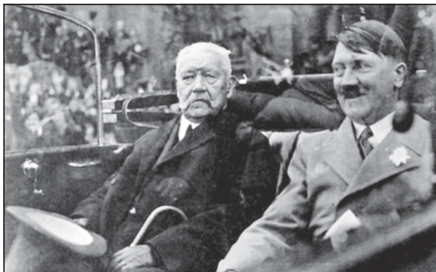
Hindenburg i Hitler.

Aleshores, igual que l'any 1914, Alemanya era la preocupació central de tota Europa. Trilla es mostrava amoïnada per l'èxit que el Partit Nacionalsocialista estava tenint arreu (Alemanya, Àustria,...) i creia que el dictador alemany havia dut la seva nació a un nivell de desprestigi que no era digne