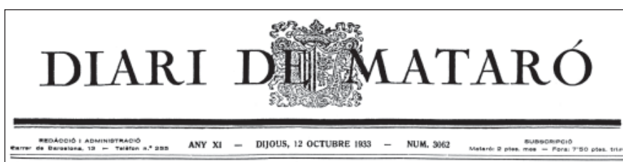
Capçalera del Diari de Mataró .

Redacció: Argentona, 24 –el carrer es deia aleshores Carles Padrós– i després carrer de Barcelona 13, seu de la Impremta Minerva.