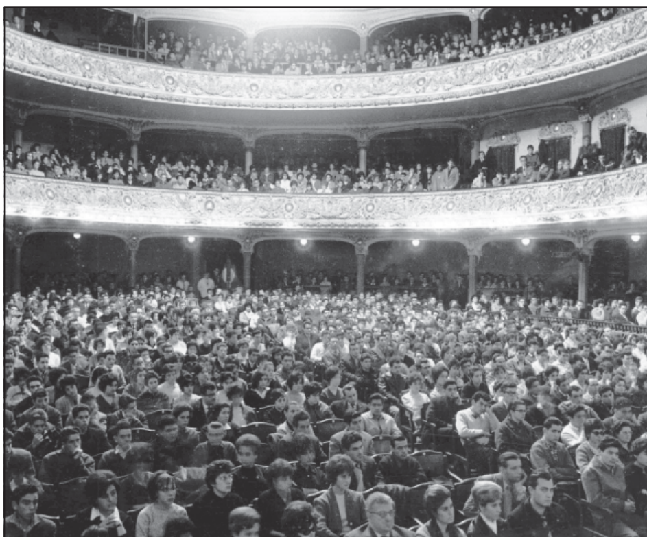
Santa Missió de Mataró (1961). Acte al Teatre-Cine Clavé. MASMM. Arxiu d'Imatges.