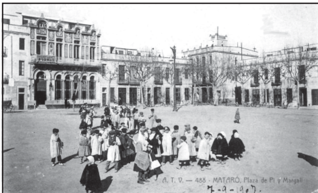
Plaça de Cuba, aleshores de Pi i Margall, amb l'edifici de la Unió. Postal ATV. Col·lecció F. de P. Enrich i Regàs. MASMM. Arxiu Imatges.

4.- El Centro de Clases era l'anomenada Casa del Poble, situada a la cantonada del carrer de Santa Marta amb el carrer Deu de Gener (ara plaça de les Tereses). Després del 1939 l'edifici de la Casa del Poble va ésser utilitzat per diverses organitzacions del «Régimen», com l'Auxilio Social, i va esdevenir finalment seu dels «sindicatos» franquistes. Enderrocat, al seu solar es va construir un edifici de nova planta com a seu de l'«Organización Sindical».