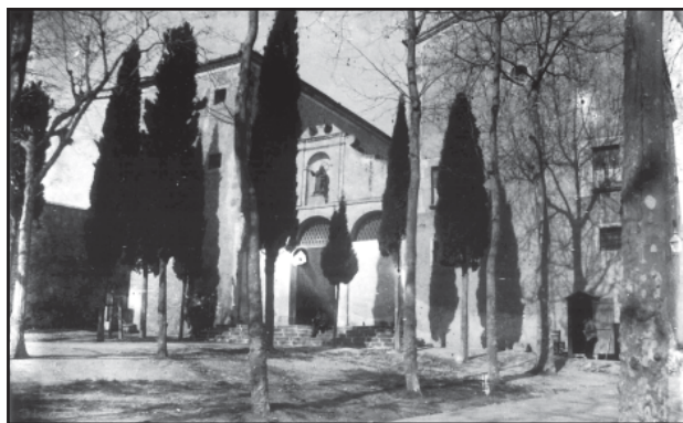
Façana del convent de les Caputxines. A la dreta, la caseta dels burots.

6.- Els Fielatos de Consumos eren les casetes dels burots. Eren situades a totes les entrades de la ciutat, i servien perquè un funcionari municipal, el burot, cobrés o recaptés els arbitris municipals que gravaven els articles de consum, especialment els productes agrícoles, que entraven a la població. Per aquest motiu, tenien poques simpaties entre les classes populars.