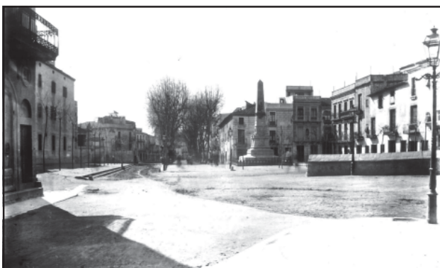
La plaça de Santa Anna vista des de la Riera. En primer terme, a mà dreta, la llissa.

2.- La plaça de Santa Anna, aleshores de la Llibertat.