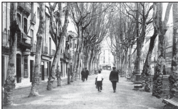
La Rambla a inici del segle xx. Postal Fototípia Thomàs. Col·lecció Francesc de P. Enrich i Regàs. MASMM. Arxiu d'Imatges.

11.- La rambla de Castelar és actualment la Rambla.