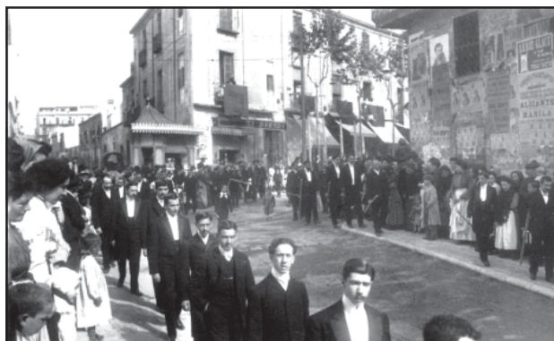
La casilla d'en Mataró, al final de la Riera cantonada amb la muralla de Sant Llorenç.

8.- La casilla d'en Mataró era una caseta de begudes, situada al capdavant de la Riera, a la cantonada amb la muralla de Sant Llorenç, i tocant la llissa, o paret, que desviava les aigües de pluja que baixaven per la muralla, a través de la plaça de Santa Anna, fins al rec del Molí. La «muralla que hay al lado de la citada casilla», tal com diu el text, era la llissa.