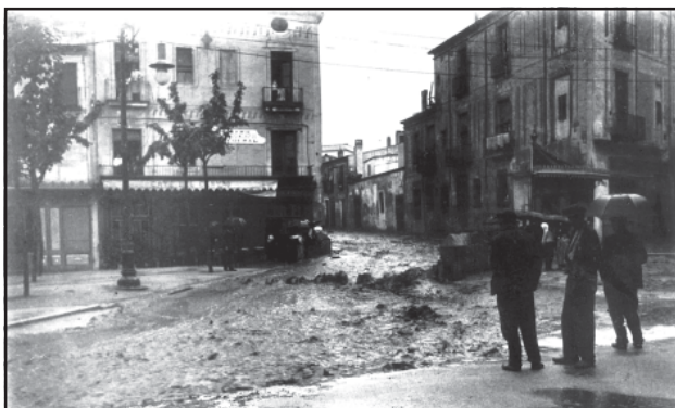
Façana del Centro Republicano Federalista Radical, plaça de Santa Anna.

3.- El Centro Republicano Federalista Radical era a la plaça de Santa Anna, núm. 8, primer pis. Pel desembre de 1909 va passar a la plaça de Cuba, aleshores plaça de Pi i Margall, al local de la Unió.