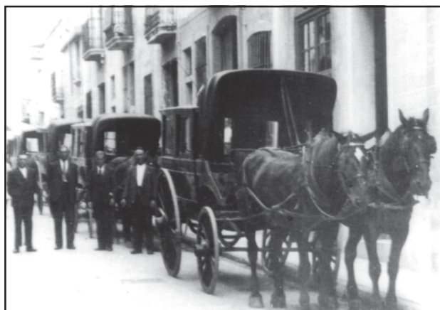
Els cotxes de bateig al carrer dels Àngels (ara carrer del Portal de Valldèix) (c. 1945).