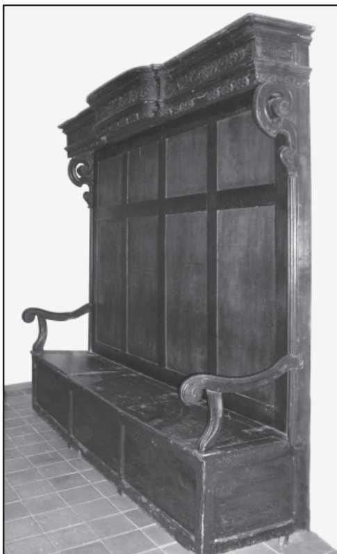
Banc de l'Administració de les Ànimes (1750). Museu Arxiu de Santa Maria. Secció Santes.

Els administradors també s'ocupaven dels confreres, que eren les persones que pagaven una quota per al manteniment de tots aquests actes i, al moment de la seva defunció, se'ls feia dir una missa.