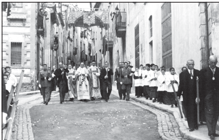
Processó del Combregar General (c. 1960).

matí del diumenge pujant Riera amunt. És una olor que enyoro, la de la cera pels carrers. Presidia la comitiva el pendó de la Minerva que acostumaven a portar tres nuvis, o sigui, tres persones de la parròquia que s'haguessin casat aquell any. Aquests també presidien l'ofici del Dijous Sant i la petita processó de portar el Santíssim al Monument.