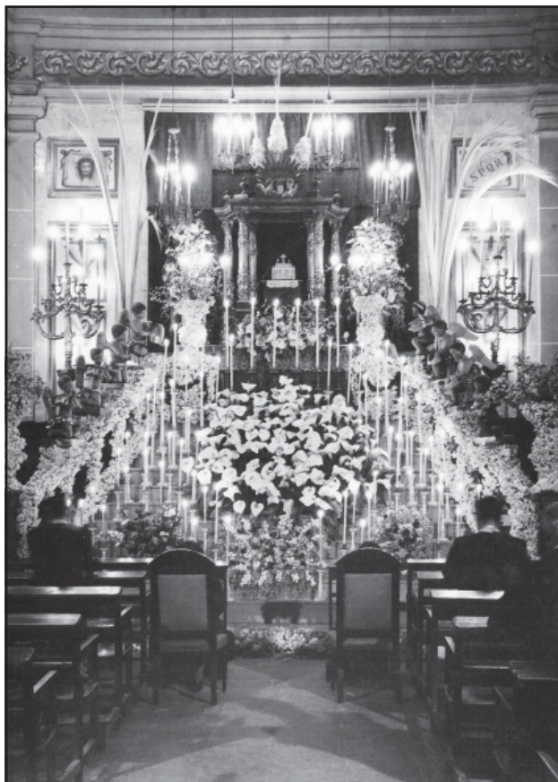
Monument de Santa Maria (c. 1950).

els senyors només feien una lleu inclinació de cap i es treien el capell, aleshores encara se'n duia, i els altres només iniciaven unes poques paraules de salutació. «Anar a seguir» consistia a fer una visita als monuments de diverses esglésies. Amb la meua família anàvem al Cor de Maria, a Valldemia, a les «Siervas», a la Coma, a les Caputxines, a l'Hospital, a Santa Anna, a Sant Josep i a algun altre. Entràvem uns minuts a cada capella, suposo que els pares resaven, però nosaltres ens entreteníem badant en l'ornamentació. Al vespre d'aquest dia, hi havia l'Hora Santa de pregària davant del Monument.