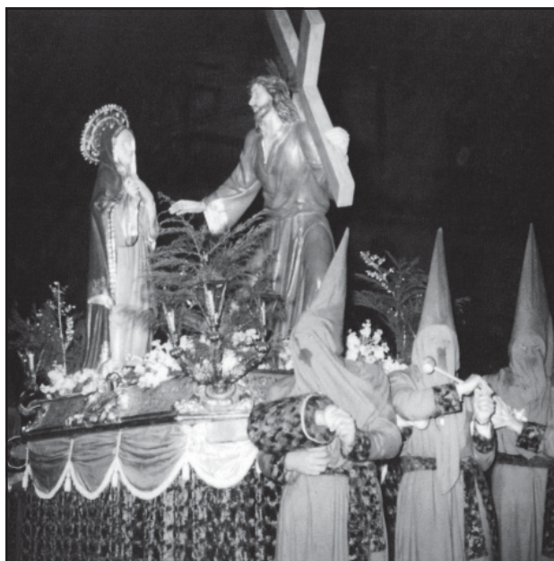
Misteri de «Jesús troba la seva mare», dels Antics Alumnes de Santa Anna (c. 1955). S'hi observen els portants amb vesta i cucurulla grisa i faixa blava.

A la tarda d'aquest dia «s'anava a seguir». Era una tradició molt viva i tot un espectacle veure les famílies senceres mudades de cap a peus, les senyores amb mantellina de coixí i la seva peineta, i els senyors amb el capell que es treien cerimoniosament per saludar contínuament. D'aquestes mantellines llargues, també en deien mantons, i antigament cadascú es feia la seva. El Dijous Sant era el dia de lluir-les. Era tot un ritual, i per nosaltres molt divertit de saludar ara i adés les mateixes famílies, perquè quasi tothom feia el mateix recorregut, però com que eren dies de recolliment