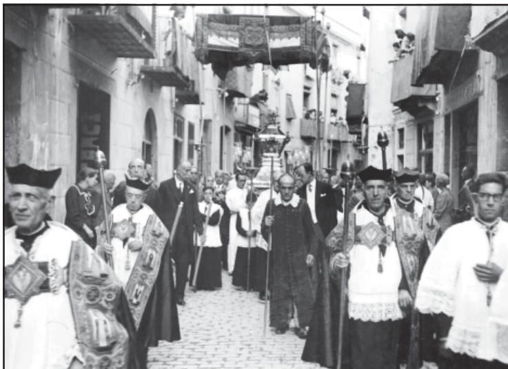
Processó de les Santes (c. 1950).

determinat. Però com que representava una despesa important, no tothom es podia permetre el luxe de fer-ne dir pels seus. Això creava diferències. Han canviat moltes coses, penso que algunes d'elles per bé.