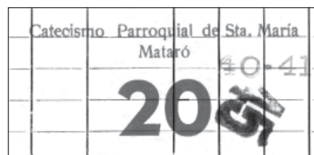
Cartronet de vint punts, que en dèiem assistències, del catecisme de Santa Maria, validat els anys 1940, 1941 i 1945. Hi havia assistències de cinc, deu, vint i cent punts.

Per premiar la presència i incentivar la puntualitat, just a l'entrada es situaven dos catequistes que anaven repartint uns cartronets de color taronja, una mena de punts, que en dèiem «assistències».