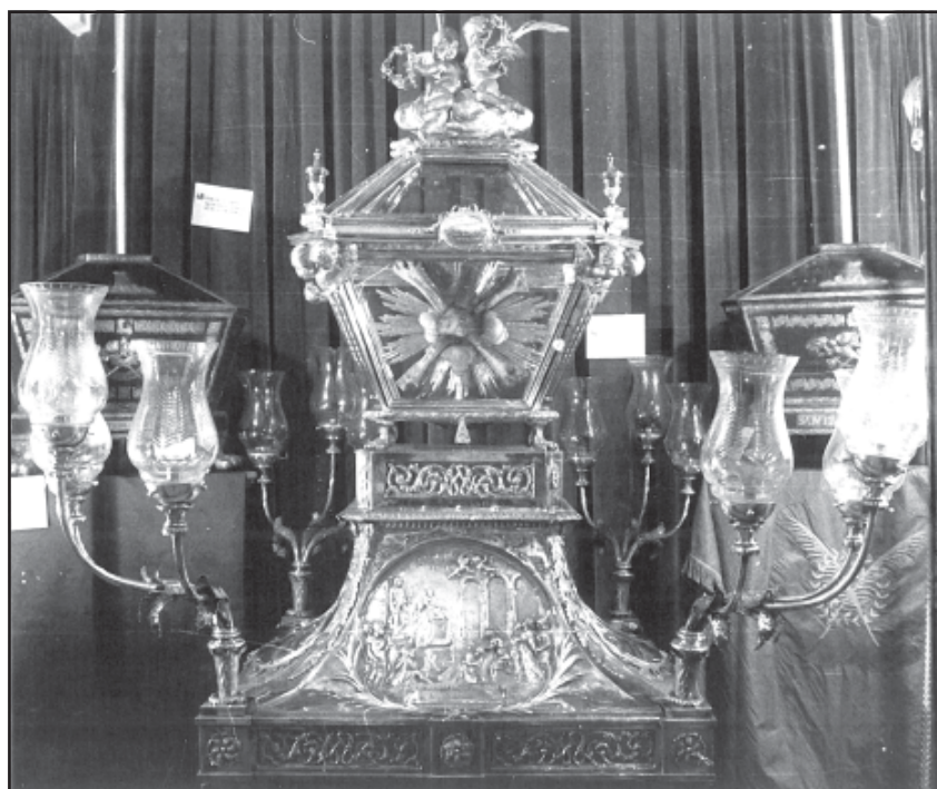
El tabernacle de les relíquies de les Santes a la secció Santes del Museu Arxiu.