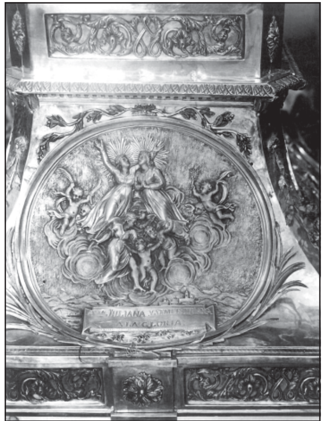
El tabernacle de les relíquies de les Santes. Detall del suport. Glorificació de les Santes. MASMM. Arxiu d'Imatges. Núm. 002080.