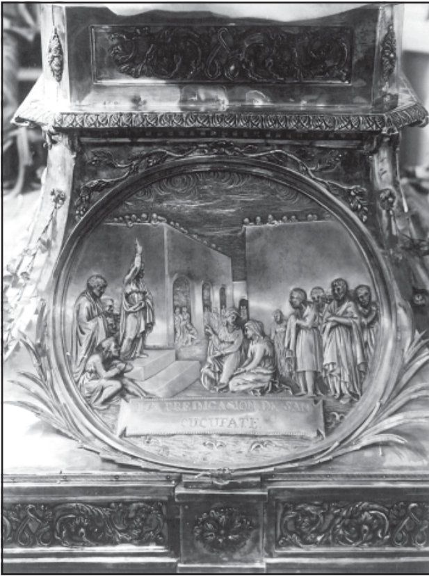
El tabernacle de les relíquies de les Santes. Detall del suport. La predicació de sant Cugat. Núm. 002081.