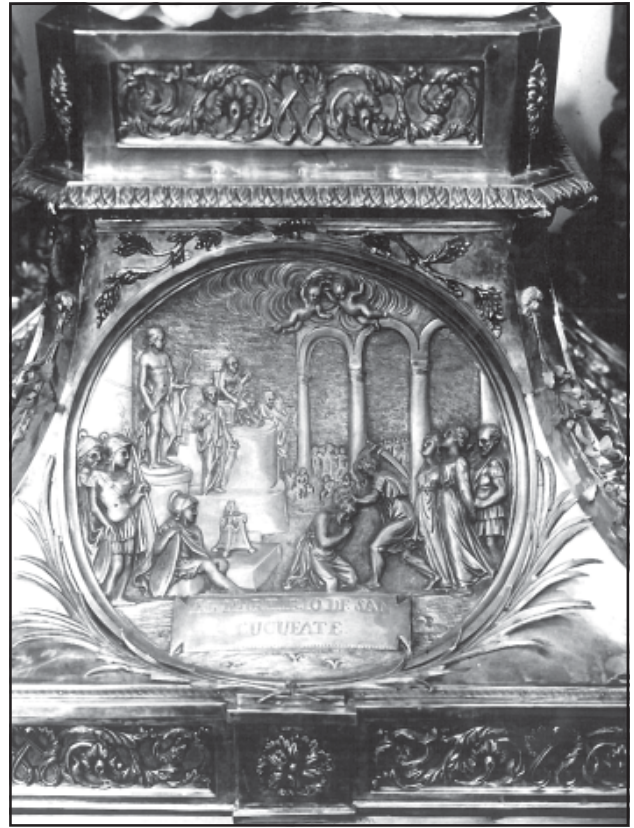
El tabernacle de les relíquies de les Santes. Detall del suport. El martiri de sant Cugat. MASMM. Arxiu d'Imatges. Núm. 002086.