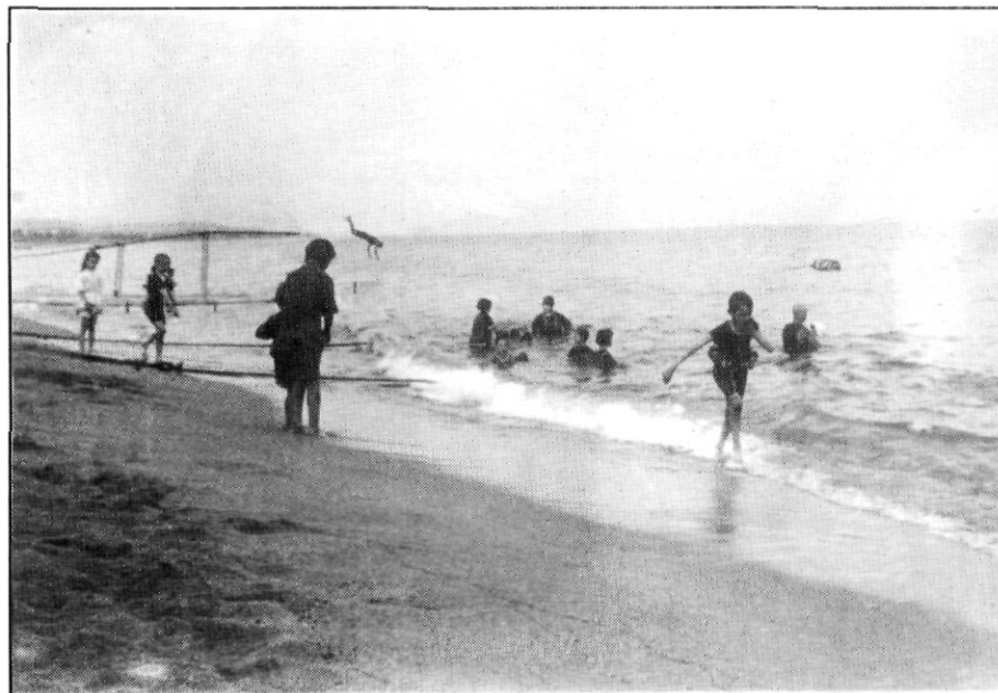
Banyistes a la platja de Mataró. Dintre del mar, a la dreta, la bota.

en compte que a la ciutat no hi havia cap auto. Els carruatges que hem anomenat pertanyien a cases distingides.