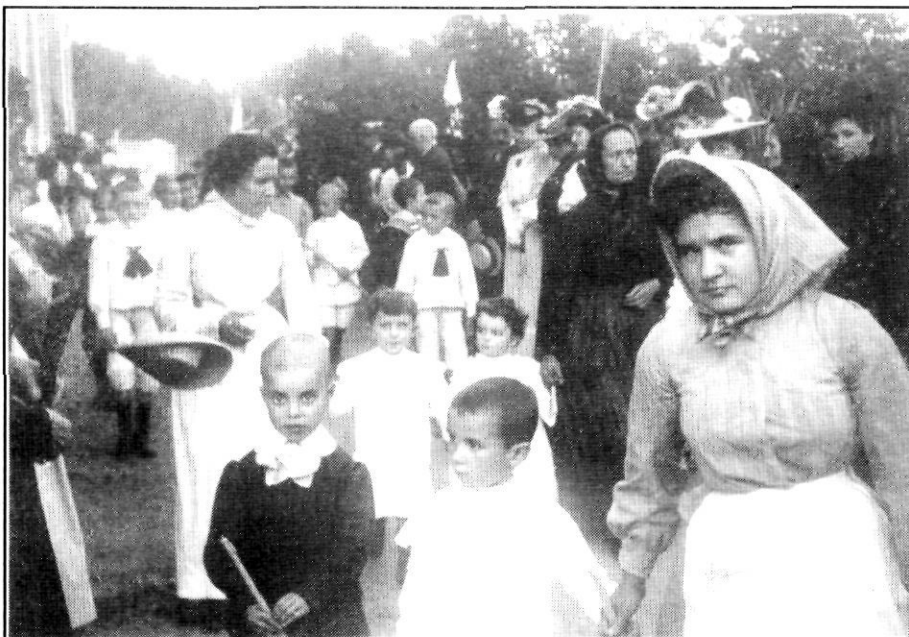
La vestimenta de les dones (1905?).

Els guants eren una cosa a la qual les senyores tenien una gran estima, i que portaven de pell, o bé de tul, segons les oportunitats. I després de parlar dels guants, és natural que ho fem del vano, del qual es deia que, a més de donar innegable relleu a l'elegància de les senyores, no solament servia perquè aquestes es donessin aire, sinó que, manejat per mans expertes, també tenia el privilegi de transmetre amorosos missatges.