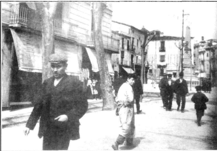
Els membres de la classe treballadora usaven gorra (1905?).

Els nois en edat escolar, o portaven gorra amb visera de xarol o d'aquelles que se'n deia de «mariner», que eren rodones i amb una cinta que acabava amb un llaç. Els alumnes dels Germans Maristes i de l'Escola Pia, sobretot aquells que eren interns, portaven la que s'anomenava «gorra de col·legial», que anava voltada per una cinta ornamentada amb uns brodats daurats i amb l'escut corresponent a la institució docent de la qual eren alumnes.