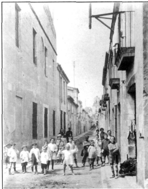
El carrer de Sant Francesc de Paula a l'inici del segle xx, vist des de baix a mar.

Escrutant i atenent les inscripcions que s'efectuaren a la llicència del ministre de Marina de Mataró, podem ara conèixer els dies de navegació per anar d'un port a un altre, quins eren aquests ports (Sevilla, Cadis, Orà, Ceuta, Gibraltar...), els sojorns per a descansar o per a carregar i descarregar, la mercaderia transportada