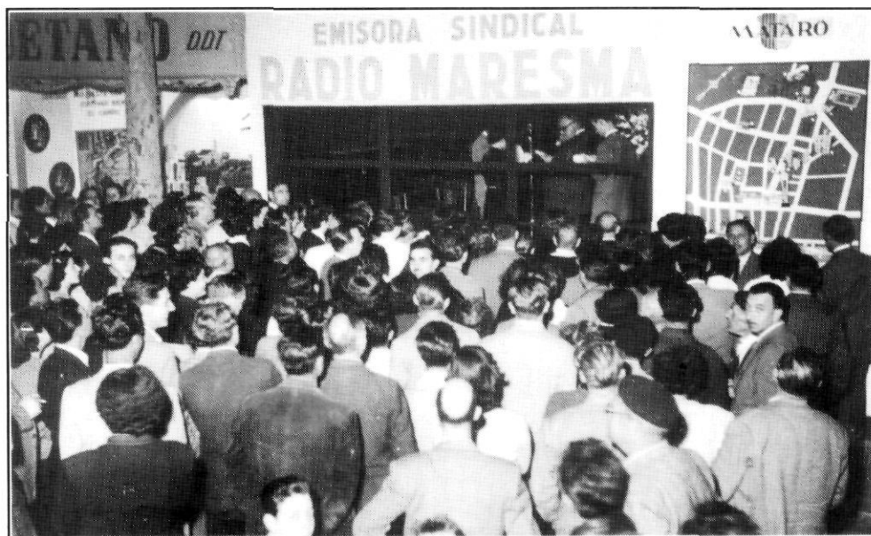
Stand de Ràdio Maresme a la Fira de Mataró (1953).