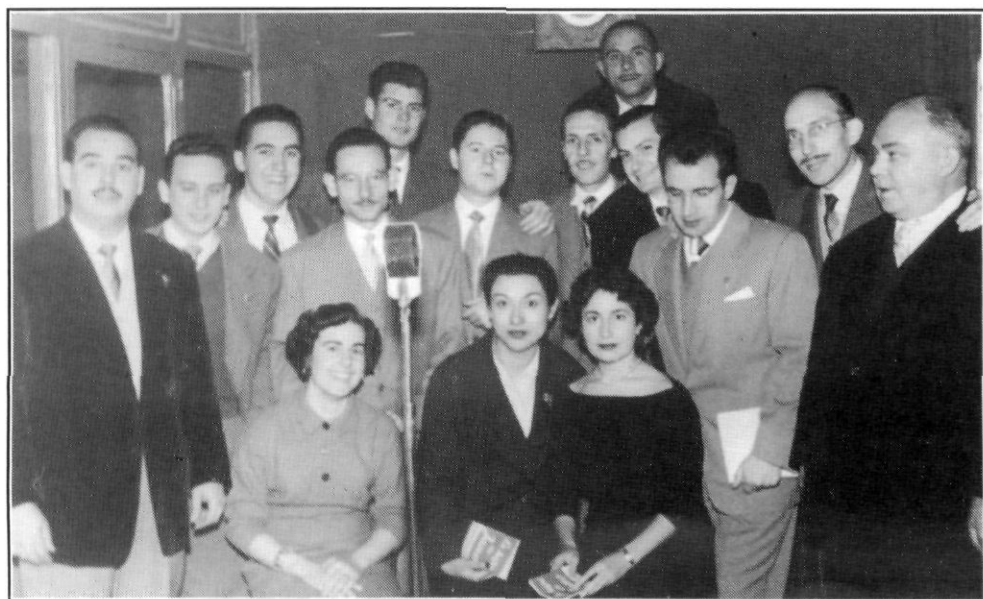
Quadre escènic i tècnics de Ràdio Maresme de Mataró (1956).

Després del conte es radiava música, i a tres quarts de nou «Carnet Deportivo», amb la sintonia de Los Voluntarios, que en sentir-la, l'equip de redacció d'esports