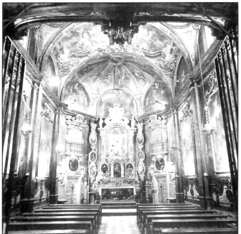
Capella dels Dolors. Basilica de Santa Maria de Mataró.

L'esment de Viladomat com autor de la decoració de la capella que fa Maldà en les Miscel·lànies dels anys 1770, 1780 i 1790, s'ha