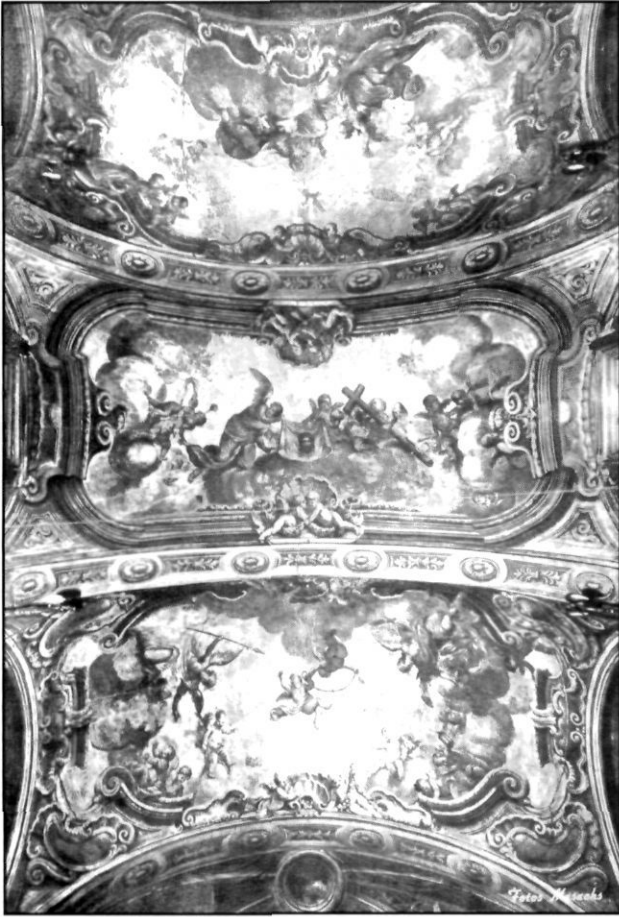
Volta de la capella dels Dolors de Santa Maria de Mataró.