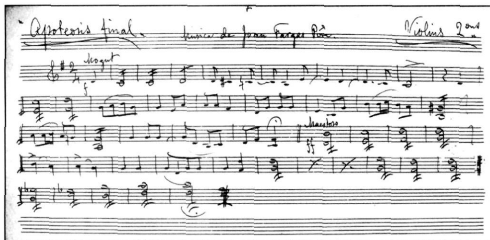
Particel·la de violi segon de l'Apoteosis final.

amb alegria i Glòria. Totes elles estan localitzables en les còpies conservades a l'arxiu, que daten des de 1924. Poc després de l'escriptura de L'Estel de Natzaret per Ramon Pàmies, que pertanyia al Cercle Catòlic de Gràcia, mossèn Miquel Ferrer, amic de l'escriptor, hi afegí la música. Queda constància que l'estrena definitiva fou el 25 de desembre de 1903. 7