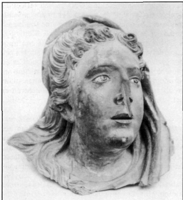
Testa de Maria, que formava part del grup escultòric del Misteri de la Purificació al retaule de Santa Maria.