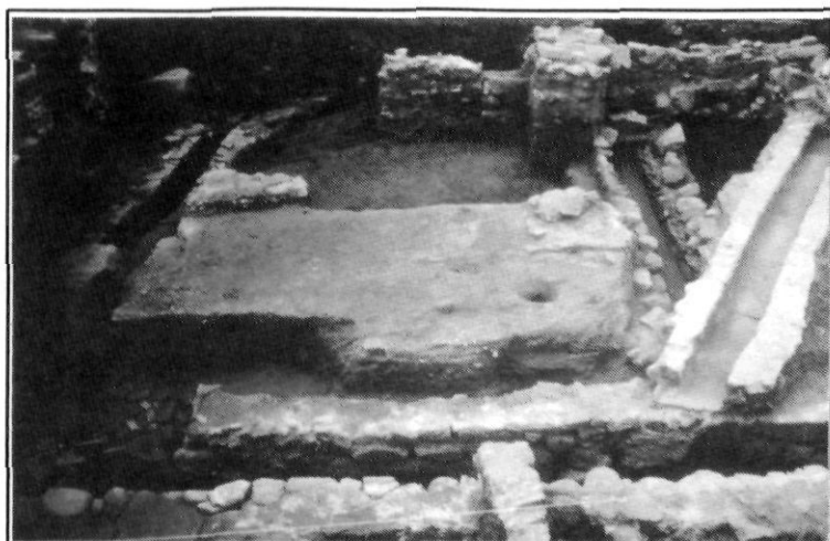
Carrer de Sant Cristòfor 12 (can Puig/can Fullercas). Any 1989. Detall del cardo maximus d'Iluro.

les rierades, i reforçaven els marges del curs baix de les rieres. En aquesta plana es van assentar la majoria dels establiments romans dedicats a l'explotació agrària, amb un sòl especialment fèrtil i ric en recursos hídrics subterranis. Algunes àrees puntuals, properes a la línia de la costa, devien ser ocupades per aigua-molls, zona poc propícia per a viure però important per a l'obtenció de recursos.