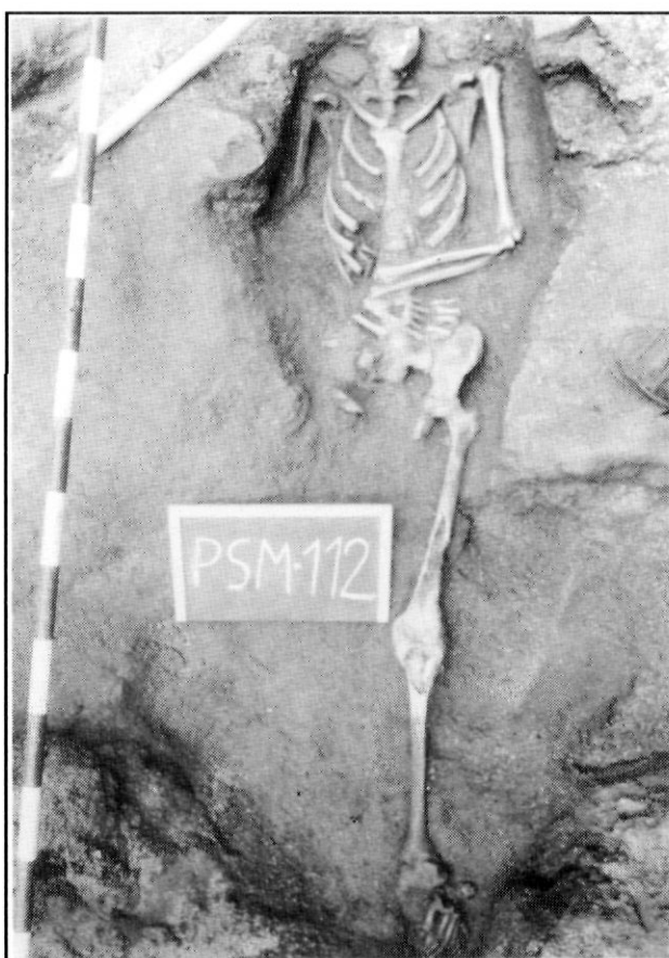
Plaça de Santa Maria. Any 1990. Enterrament en fossa simple. Segle IV d.C.

- Carrer de Sant Francesc d'Assís núm. 19. Restes d'una casa construïda en època augús-