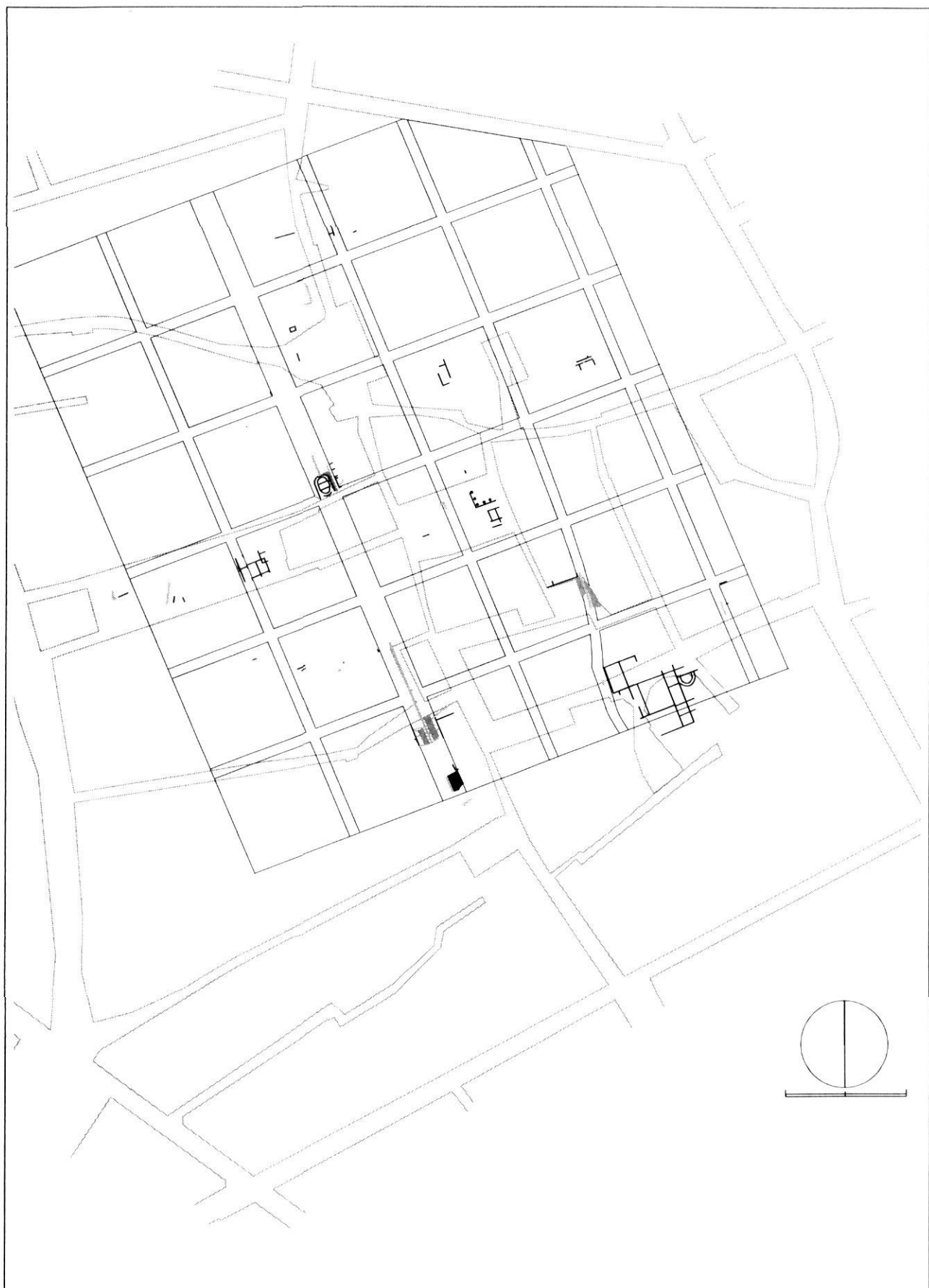
Restitució hipotètica de la trama urbanística d'Illuro (segons Cerdà, García, Martí, Pera, Pujol i Revilla. 1993).