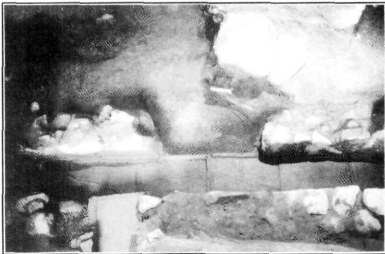
Carrer de Sant Francesc d'Assís 19. Any 1993. Detall de la claveguera d'un cardine de la ciutat romana.