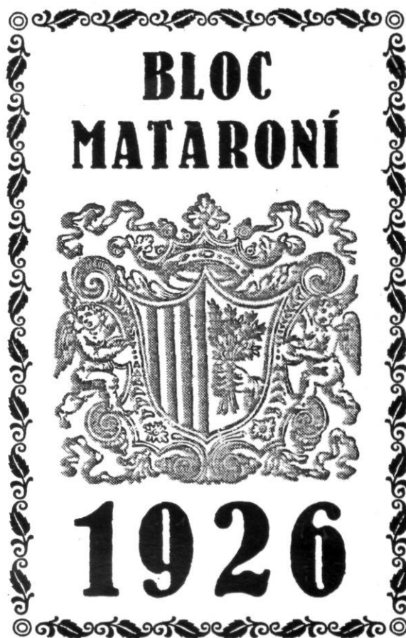
Portada del Bloc Mataroní (1926).