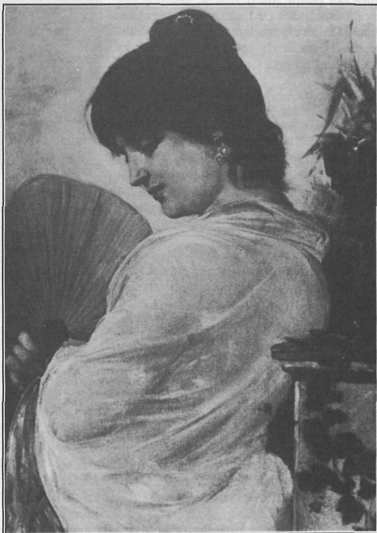
Retrat de dama amb pai-pai. Oli sobre tela. Museu Comarcal del Maresme núm. 5851.

El Museu Arxiu de Santa Maria de Mataró conserva una tela de Martí Alsina, de temàtica religiosa, procedent de l'Hospital