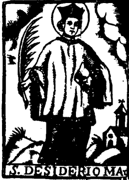
S. DESIDERIO MA

GOIGS EN de Sant Desi- yo Cos fe ve- roquial Igle- tat de