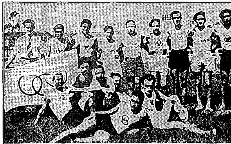
L'equip de la secció atlètica de l'Iris, l'any 1934, a Granollers.

L'any 1930 un grup de joves del Foment Mataroní, amb el nom de Joventut, prengué part en els campionats locals, amb marques discretes. L'any 1931, en formar-se la Federació de Joves Cristians de Catalunya, a Mataró es constituïren tres grups: