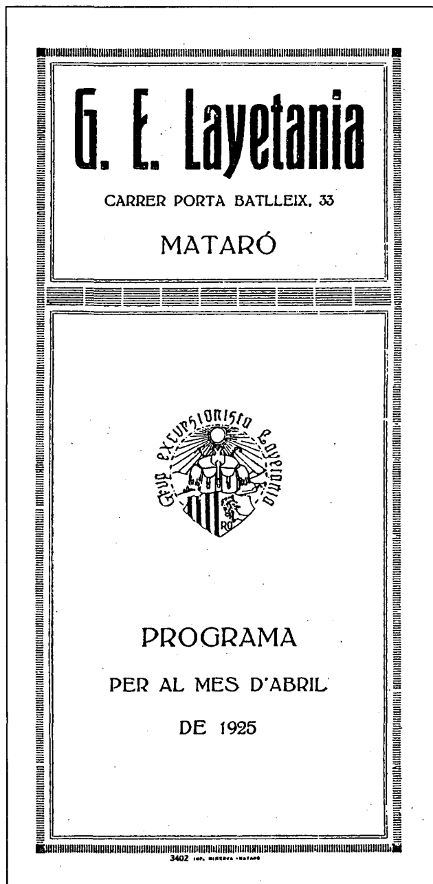
Programa d'activitats del Grup Excursionista Laietània (abril 1925).

condicions rigorosament hivernals, essent la primera ascensió nacional.