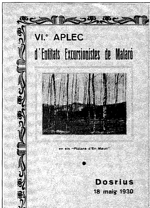
Programa del VI Aplec d'Entitats Excursionistes de Mataró (1930).

Per què practiquem l'Excursionisme; també la fotografia acostumada de cada Butlletí, feta per J. Ballbé.