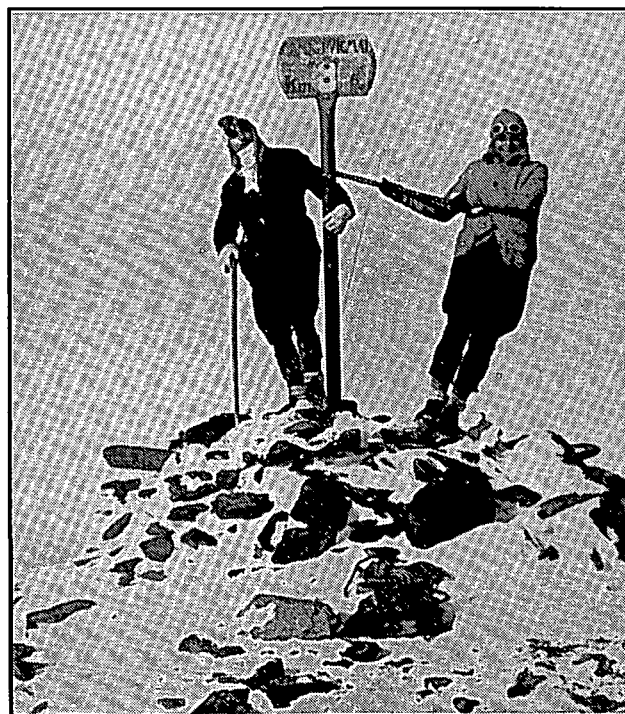
Al cim del Puigmal (desembre 1929).

També s'hi agombolen els Minyons de Muntanya, l'equivalent a la catalana dels Boy-Scouts de Baden Powell.