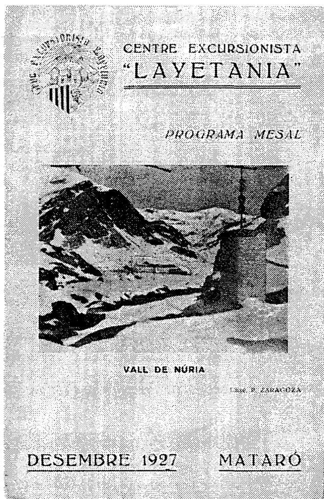
Programa d'activitats del Centre Excursionista Laietània (desembre 1927).