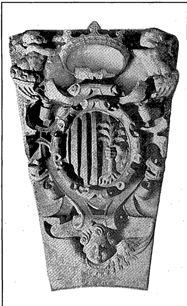
L'escut de Mataró a la dovella central del portal de la casa de la vila, traça de Llätzer Cisterna, menor (1600).

universitat té sa casa quasi inhabitable y té expresa y molt precisa necessitat de obrarse... (17), resolgué d'iniciar una remodelació general del casal del municipi i hospital.