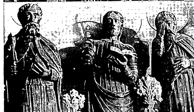
Imatges romàniques dels Apòstols. Ermita de Sant Simó. Procedien de l'església de Santa Maria. Destruïts el 1936.

portal de la sagristia, la campana per senyalar les Misses. En lo centre dos grans candeleros de ferro, cloent lo presbiteri una barandilla de ferro ab quinze brocs de ferro colat per a blandons i, en una politxa penjada al mig, una gran llàntia de flautí, ab llantió de vidre.