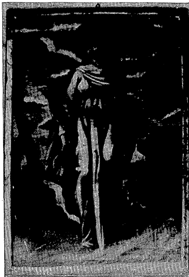
Pintura representant Santa Bàrbara. Ermита de Sant Simó. Destruïda el 1936.

de fusta per les indulgències los Srs. Bisbes de Barcelona D. Gavino de Valladares i D. Asencio, D. Bartolomé de Vic, D. Tomás de Lorenzo de Girona, i per lo Senyor Bisbe de Solsona. Ademés deu tablillas de exvotos o promences.