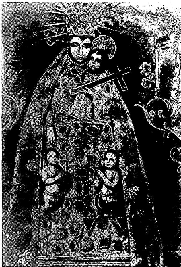
Mare de Déu dels Desamparats. Ermita de Sant Simó. Destruïda el 1936.