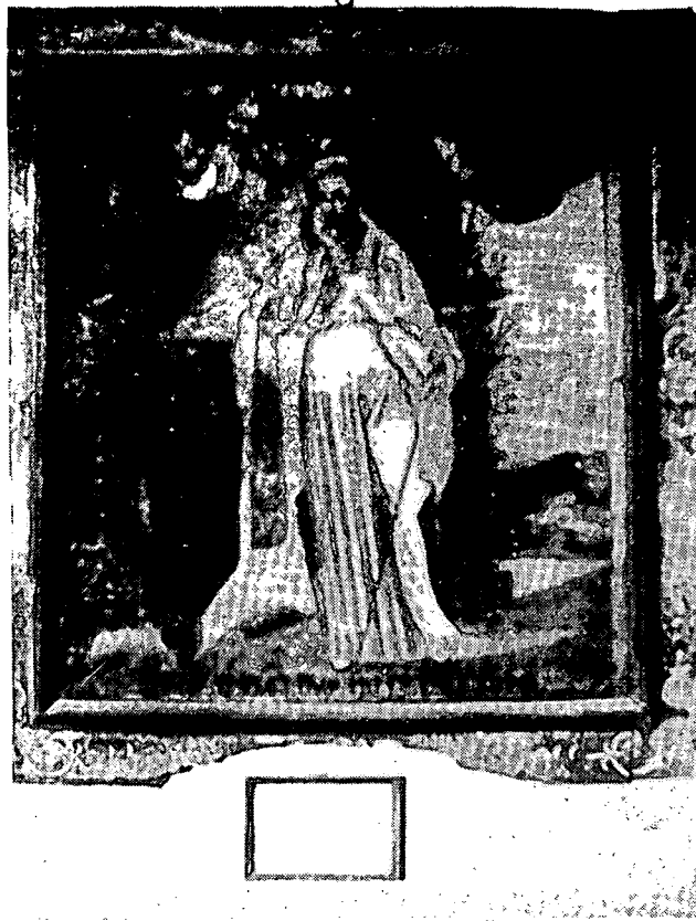
Pintura representant Sant Pacià. Ermita de Sant Simó. Destruïda el 1936. Fotografia Maria Ribas i Bertran.