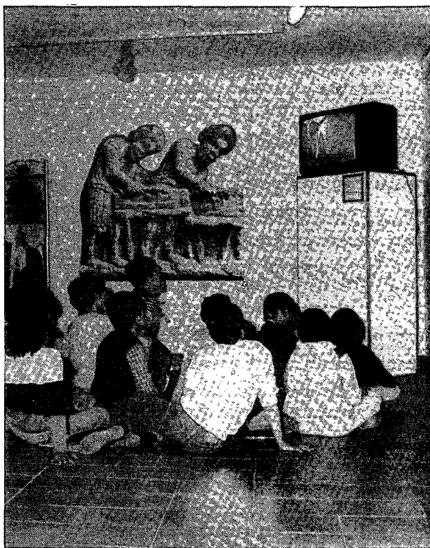
Escolars visitant l'exposició "L'Art Romànic a Catalunya". Museu Comarcal del Maresme - Mataró. Abril 1984

i s'erigia en custodiadora dels testimonis d'un passat que sempre era massa llunyà. El museu així considerat satisfia l'oci i el lleure d'uns enamorats amb excés romàntics. Amb justícia la gent del carrer tenia la impressió que, en aquests llocs tancats, regnes de la pols, s'hi practicaven seriosos, però ridículs ritus a l'abast només d'uns pocs iniciats. Així conceptuals i estructurats, en aquesta etapa els museus romanien buits, tancats al gran públic i a la societat en general.