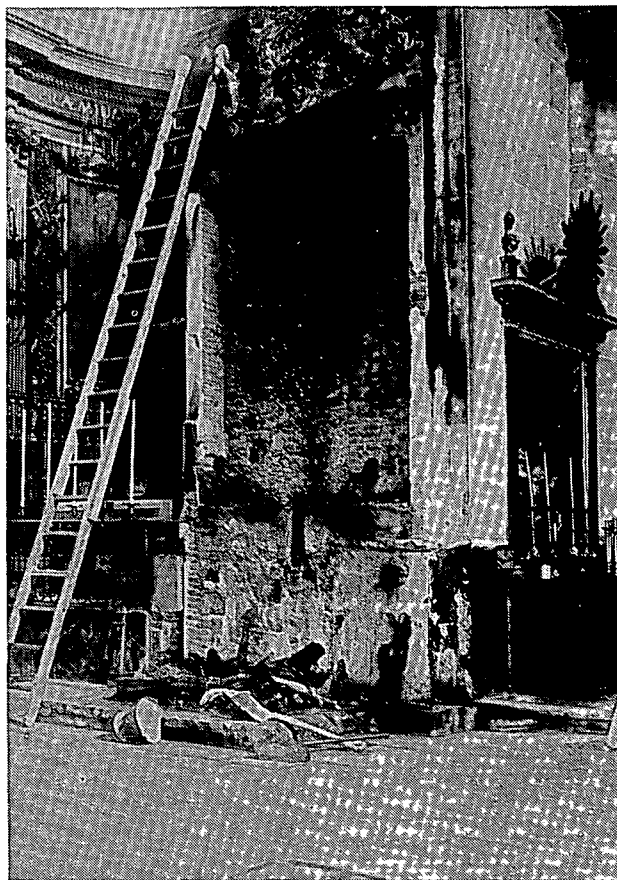
L'Altar de les Ànimes després de l'incendi del 6 d'octubre. Al costat l'altar de la Pietat.

te, no es veia ningú pels carrers i tots els locals públics i establiments romanien tancats. Però a mig matí, bullien de sobte els carrers amb la gentada que acudia al míting convocat al Parc Municipal i cridat pel nunci. Parlaren allí uns representants dels socialistes, el comunista Dalmau i el sindicalista Peiró, el qual ho féu més extensament, cridant a la revolució cas que l'Esquerra no es veiés amb ànims suficients per a portar-la a terme. Per altra part, la ràdio donava notícies en el mateix sentit.