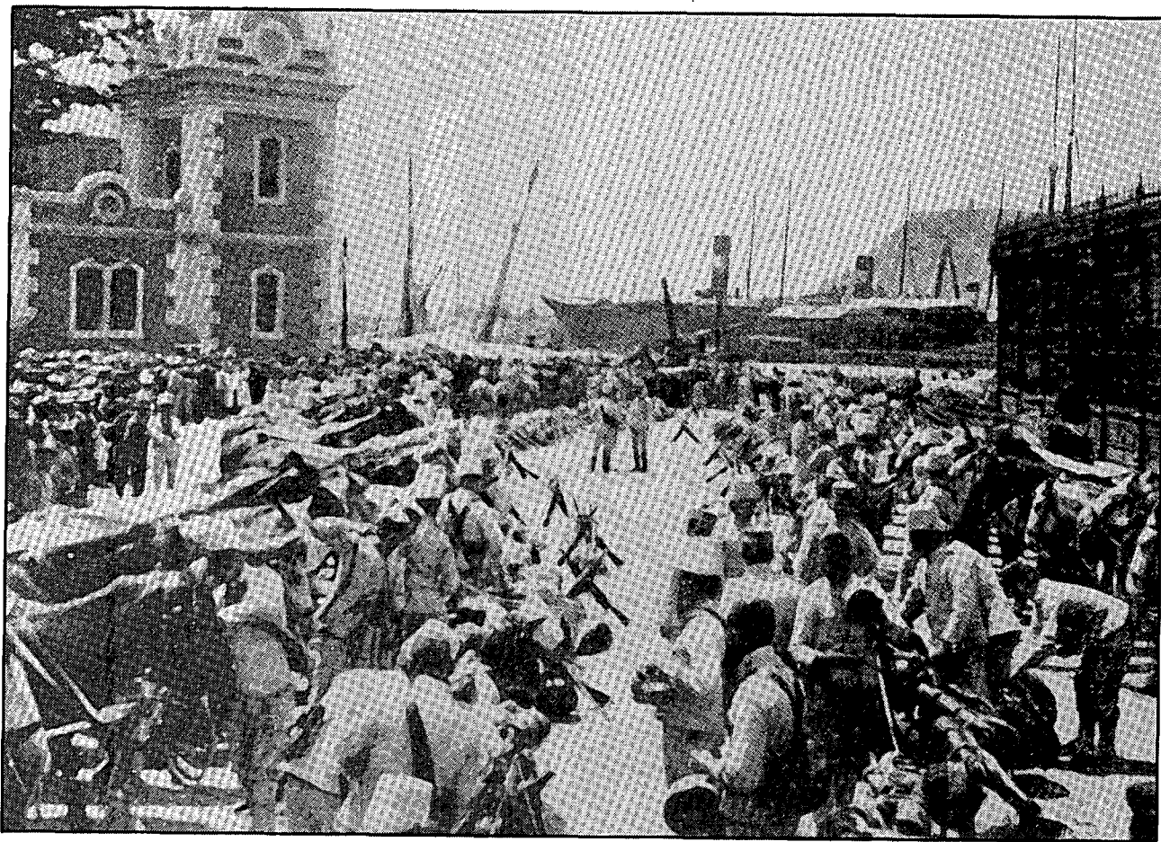
Embarcament de tropes, constituïdes en gran part per reservistes, al port de Barcelona.

llevar al Rif las armas españolas ha obrado con tal diligencia y precisión que ha merecido los elogios de las naciones más señaladas en el arte militar [...]. Dejémonos de lamentaciones inoportunas. Cuanto más decidida y vigorosa la acción de España [...] tanto más pronto quedará pacificado aquel territorio, sobre el que se dirijen las miradas ambiciosas de otras naciones [...] Allí han de ir nuestros capitales y nuestros productos para evitar esta emigración del proletariado español a tierras lejanas. Es un gran error económico que sólo los comerciantes, sólo los que comercien han de tener interés en la guerra. Imposible romper la solidaridad entre estos dos factores de la riqueza, de la producción, el capital y el trabajo, cuando éste no existe sin la preexistencia del otro. ¿Que es inicuo que vaya el pobre, y no el rico, forzado a la guerra? Este es el problema que deberíamos tener resuelto [...] ahora no hay que perturbar con estas cuestiones tantas veces debatidas [...] importa acabar la guerra bien y pronto, y para esto hay que dar tregua y no escasear apoyos al gobierno [...] Interesémonos todos por el brillo de nuestras armas, sin llorar como débiles mujeres la fatalidad aparente de unos sucesos de muy probable resultado satisfactorio para nuestro orgullo nacional.