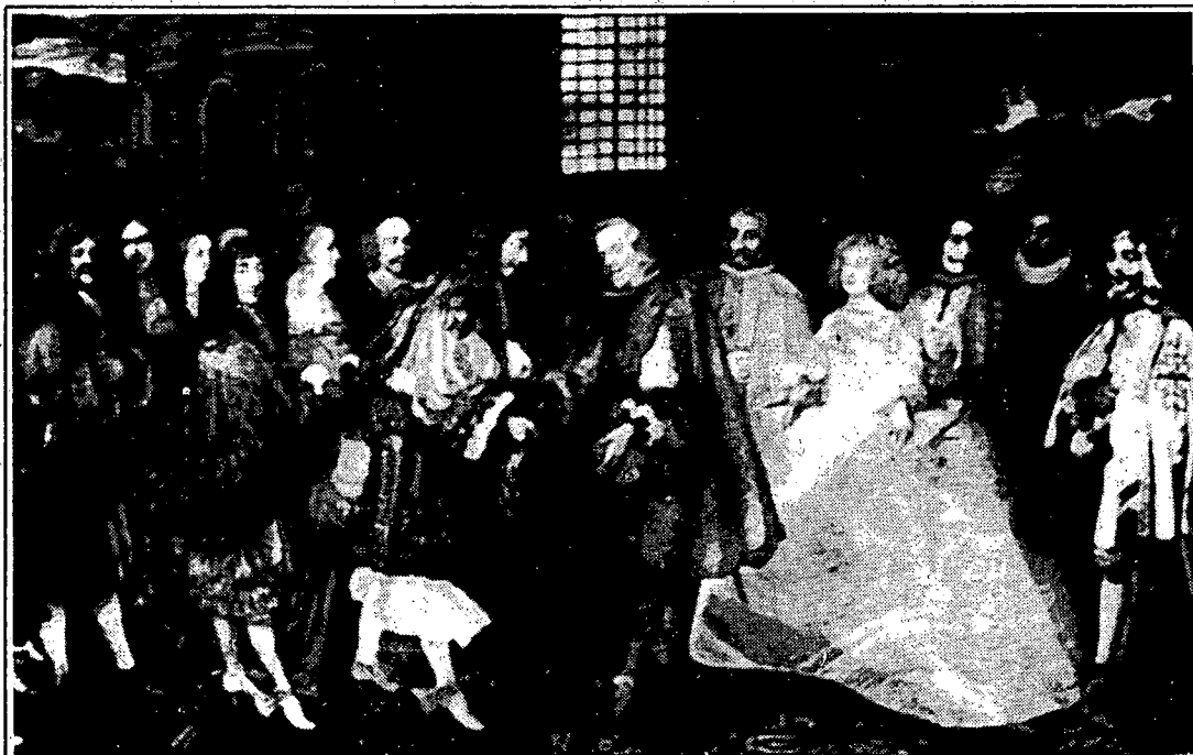
EL PLENIPOTENCIARI FRANCÈS SALUDANT A D. LUIS DE HARO, PRIMER MINISTRE DE FELIP IV. A LA DRETA LA FILLA DEL REI, LA INFANTA M a . TERESA, QUE HAVIA DE DESPOSAR-SE AMB LLUÍS XIV DE FRANÇA.