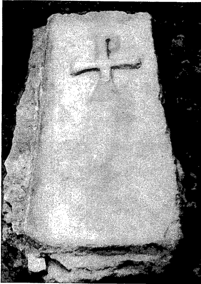
Necròpolis paleocristiana de Santa Maria. Sepultura coberta amb una lauda amb representació de l'anagrama del crismó.