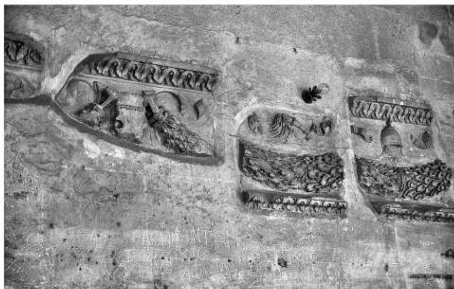
Fig. 93. Fragments encastats en un dels murs del claustre de la Catedral de Tarragona que pertanyen al fris de fulles d'alzina amb bucranis i altres elements rituals ( aspergillum, apex i culter) que formava part de la decoració arquitectònica del recinte de culte imperial de Tarraco.