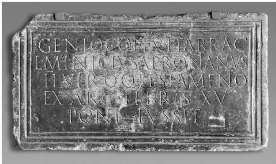
Fig. 87. Inscripció dedicada al Geni de la colònia Tàrraco (MNAT-673).