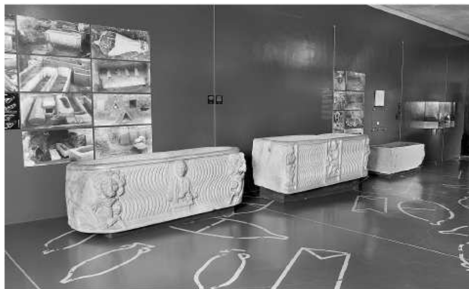
Fig. 92. Vista parcial de l'exposició "El món de la mort. Síntesi prefigurativa del Museu i Necròpolis Paleocristians de Tarragona". Necròpolis Paleocristiana.

Pel que fa a les col·leccions, el Museu té els precedents més llunyans al segle XVI, amb la iniciativa i l'impuls de l'arquebisbe Antoni Agustí i, més endavant, als segles XVIII i XIX, amb la dels canonges Ramon Foguet i Carlos Benito González de Posada. Fou l'arquebisbe Fleix i Solans qui, el 1869, va disposar la formació d'un petit museu