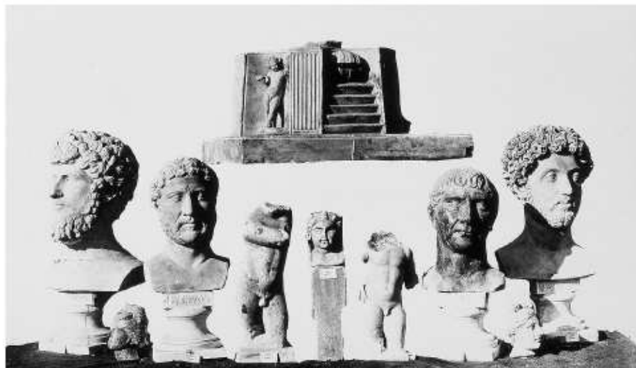
Fig. 82. "Fontaine en marbre et bustes romains (au Musée Archéologique)", ca. 1870 (Foto: J. Laurent / Arxiu Ruiz Vernacci, 4178—B.295—).