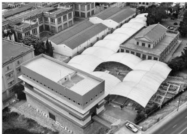
Fig. 91. Vista aèria del conjunt del Museu i la Necròpolis Paleocristians de Tarragona, amb la fàbrica de tabacs i l'edifici de Serveis Centrals del MNAT.