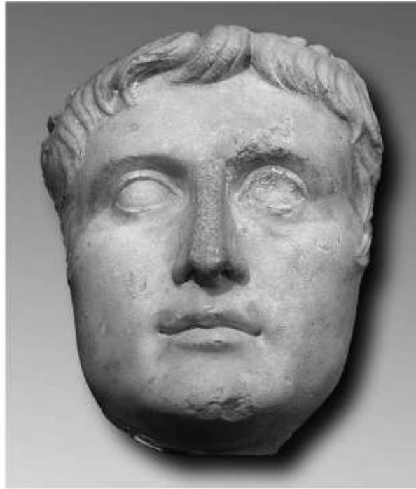
Fig. 94. Retrat d'August, procedent de Tarragona, conservat al Museu Frederic Marès de Barcelona.

Pel que fa a l'escultura, de la qual el MNAT disposa d'un corpus realment important (KOPPEL 1985a), 4 hem de destacar una peça d'entre les que es troben fora de la ciutat: el cap d'August propietat del Museu Marès de Barcelona (fig. 94).