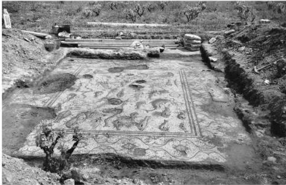
Fig. 86. Mosaic dels Peixos (MNAT-45456), de la vil·la romana de la Pineda (Vila-seca), datat la primera meitat del segle III, poc abans de ser traslladat al nou Museu Arqueològic, 1960.