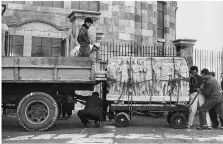
Fig. 85. Arribada del sarcòfag d'Hipòlit (MNAT-15482) a la porta del nou Museu Arqueològic de la plaça del Rei des de l'antiga seu, a la plaça de la Font, 1960.

instrumentum domesticum... — els fons del MNAT han estat objecte de nombrosos estudis parcials 2 i s'han incorporat gradualment als repertoris corresponents. En el cas de la col·lecció numismàtica, una part important va ser objecte de robatori el 1903. El fons monetari del MNAT és, doncs, actualment, el reflex dels resultats de les excavacions arqueològiques més recents, desproveït, a causa d'aquell robatori, de l'aura de col·lecció històrica que fins llavors tenia.