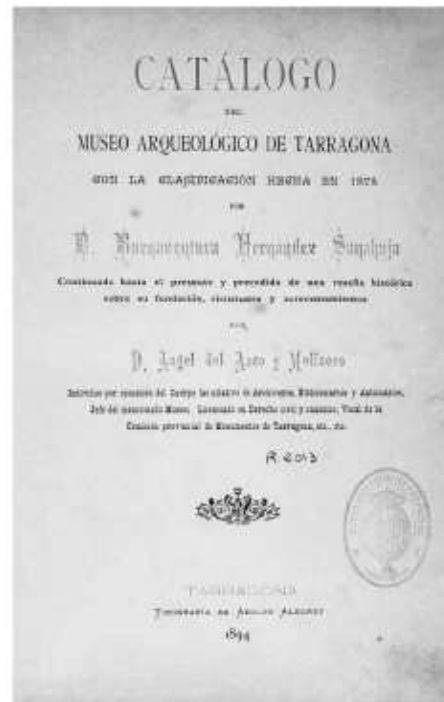
Fig. 81. Portada del Catálogo del Museo Arqueológico de Tarragona, con la clasificación hecha en 1878 por D. Bonaventura Hernández Sanabuja, continuado [...] por D. Ángel del Arco Molinero , Tarragona, 1894.