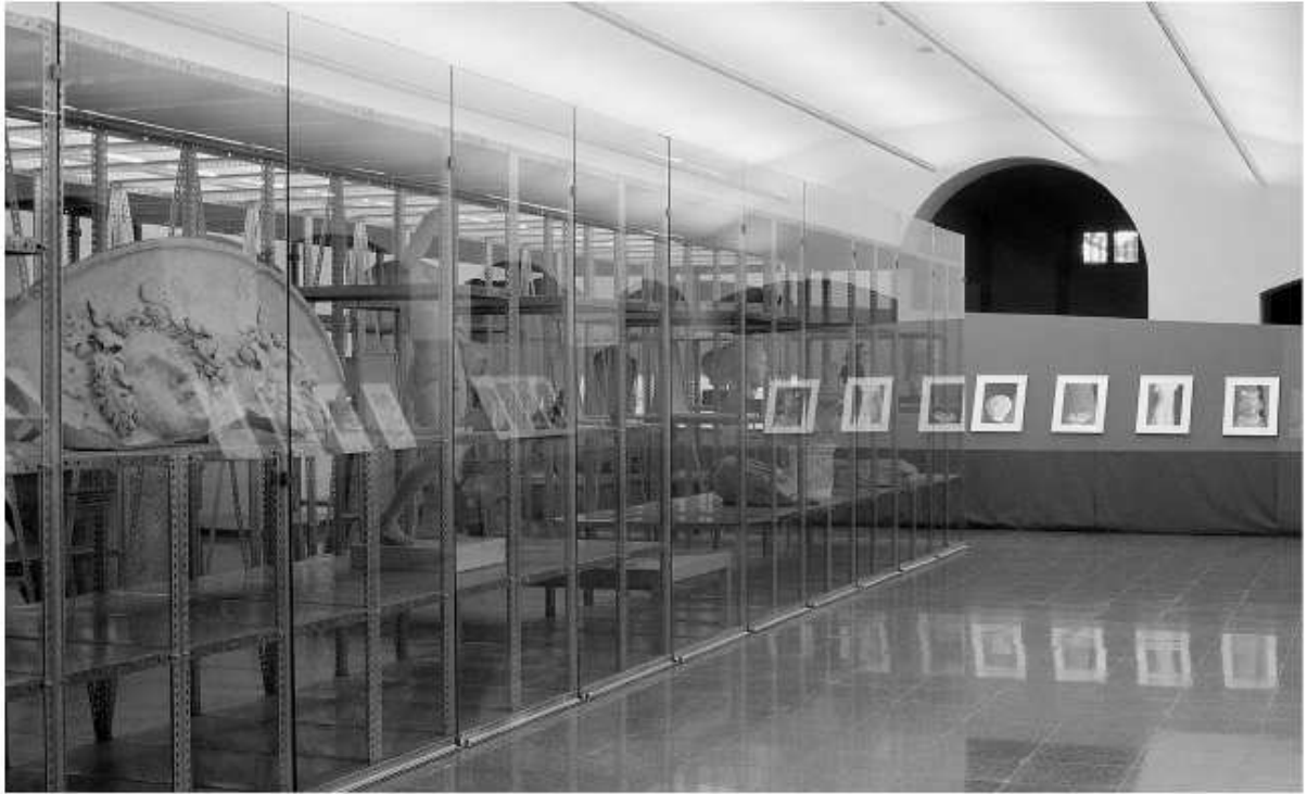
Fig. 88. Vista parcial de l'exposició "Tàrraco, objecte i imatge". Necròpolis Paleocristiana.