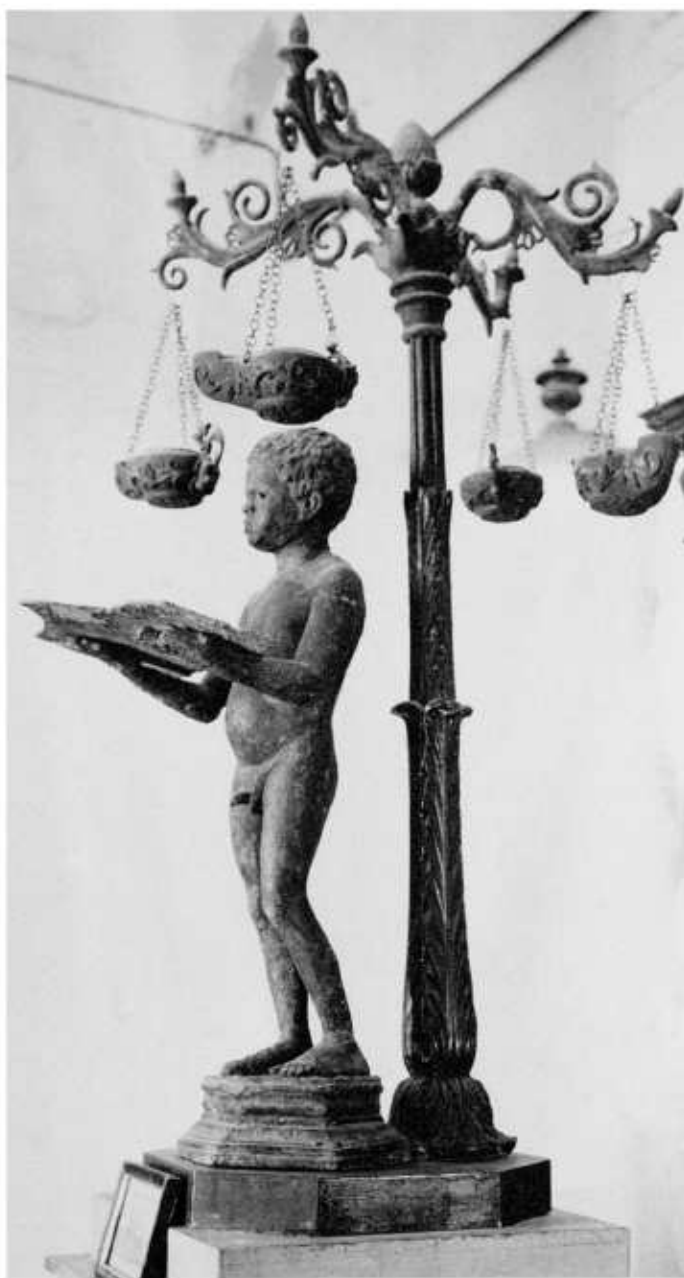
Fig. 84 El lampadari en forma de nen etiop exposat a l'antiga seu del Museu Arqueològic, a l'exconvent de Sant Domènec.