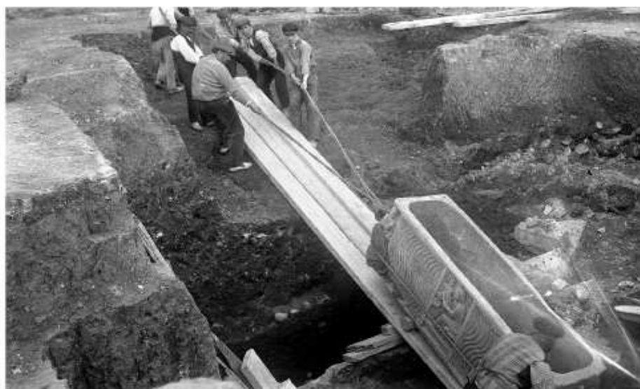
Fig. 90. Recuperació del sarcòfag del Pedagog (MNATP-60), en el transcurs de les excavacions de la Necròpolis Paleocristiana de Tarragona (Foto: J. Serra i Vilaró / Arxiu MNAT).