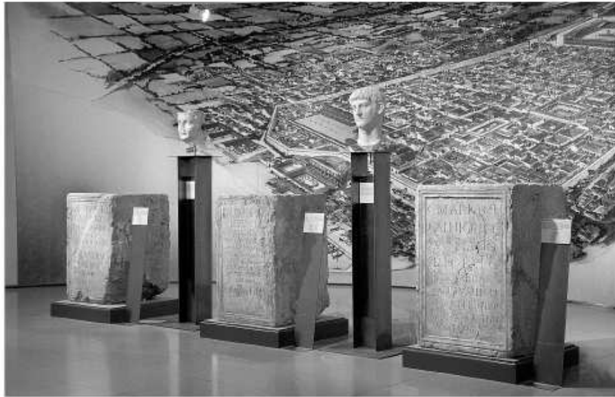
Fig. 89. Vista parcial de l'exposició "Tàrraco, una arqueologia viva". Sala d'exposicions temporals del MNAT.