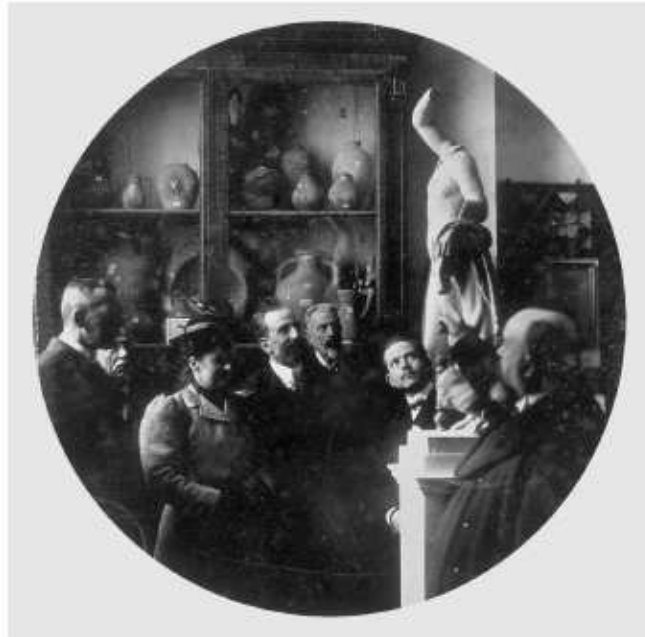
Fig. 83. Visita d'un grup de persones distingides al Museu Arqueològic el 1908.

fons i és, com a mínim des d'un punt de vista normatiu, el destí obligat de tots els materials que es troben de manera casual o programada al solar de l'antiga ciutat de Tàrraco, base fonamental de les seves col·leccions.