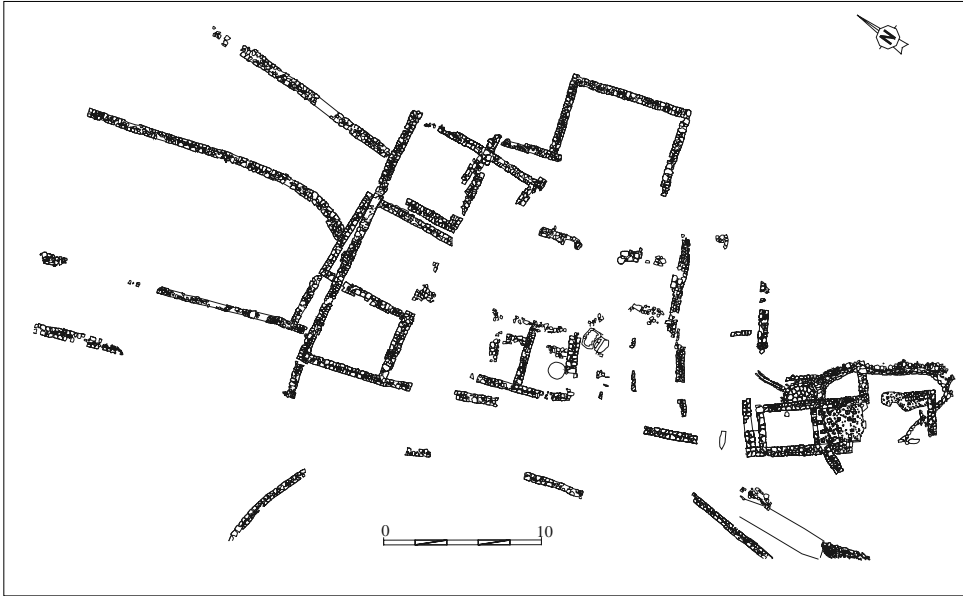
Fig. 1. Planta de les restes documentades al jaciment del Vilar (R. Palau - E. Ramón / Arxiu Codex).