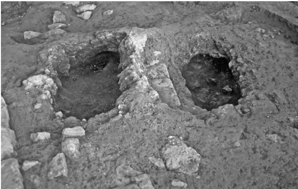
Fig. 6. Detall de les dues estructures de combustió localitzades.