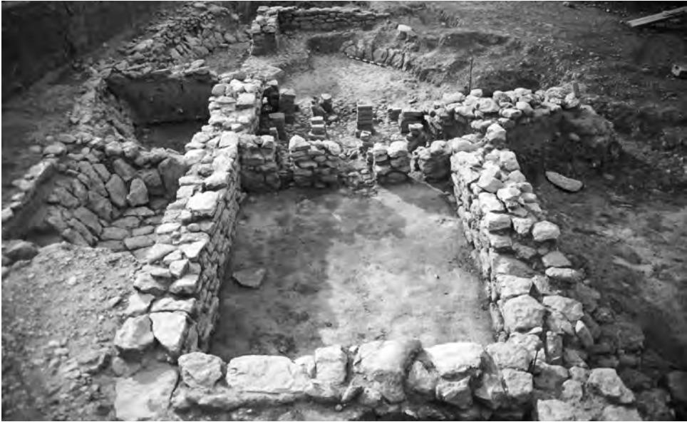
Fig. 7. Vista general del sector dels banys, construïts sobre estructures anteriors.