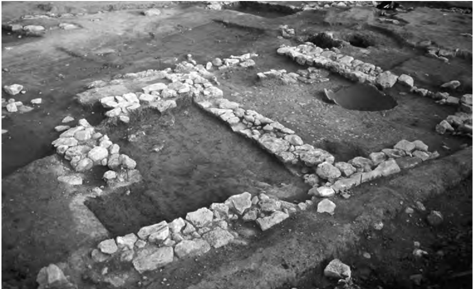
Fig. 5. Detall de dues de les estructures corresponents a la fase III, on es conserva la part inferior d'un dolium.