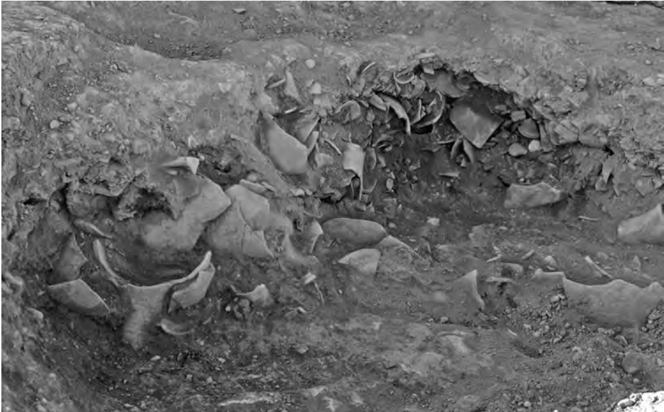
Fig 3. Detall de l'abocador ceràmic, que correspondria a la fase I.