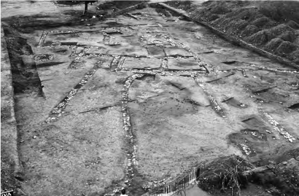
Fig. 4. Vista general de l'àrea excavada, corresponent a la zona del vial.