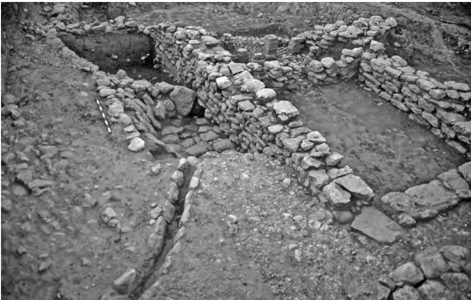
Fig. 8. Detall d'una de les estructures construïdes amb lloses, corresponents a la fase III.