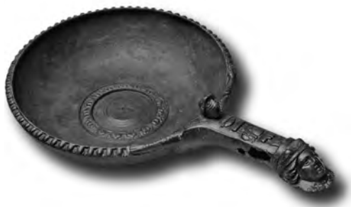
Fig. 7. Pàtera del conjunt de bronzes recuperats el 1992 (Arxiu MNAT).