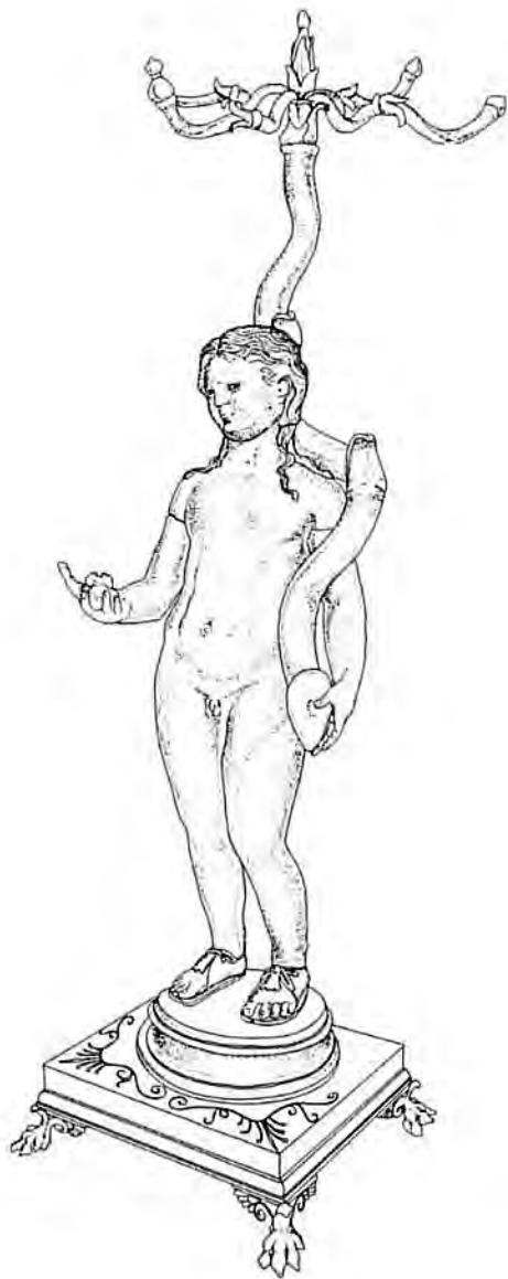
Fig. 6. Dibuix reconstruït del lampadari (R. Palau / Arxiu Codex).