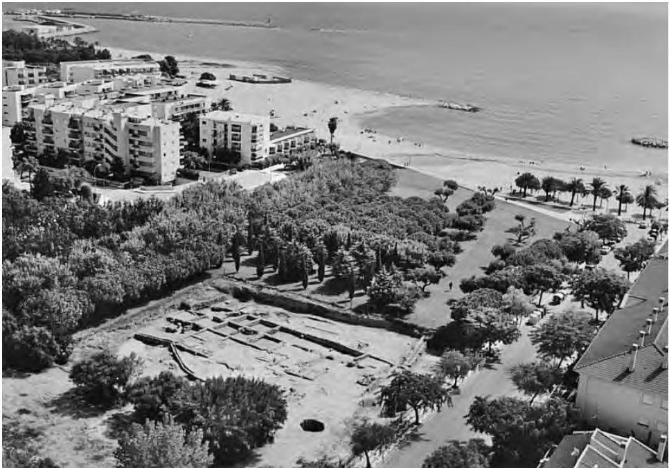
Fig. 2. Vista general del sector sud, l'any 2003, on es pot apreciar la situació del jaciment.