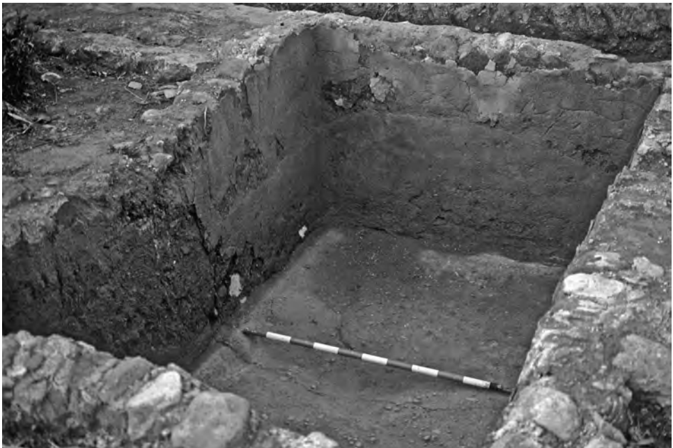
Fig. 5. Una de les restes arquitectòniques documentades al sector central durant els anys 80 (J. Massó).