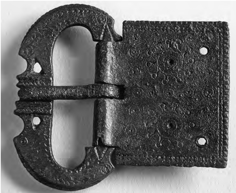
Fig. 10. Detall de la sivella de bronze.