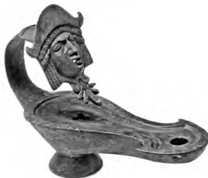
Fig. 8. Llànčia del conjunt de bronzes recuperats el 1992.