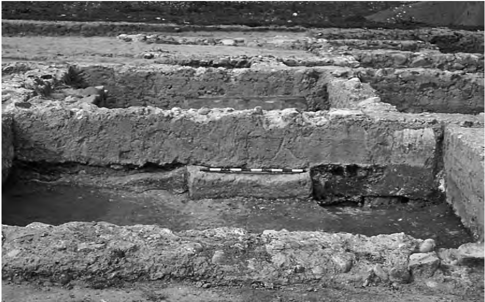
Fig. 4. Detall d'una de les estances que s'obririen al corredor en la fase I, amb una escala d'accés a un nivell superior, que posteriorment va ser paredada (E. Ramón).