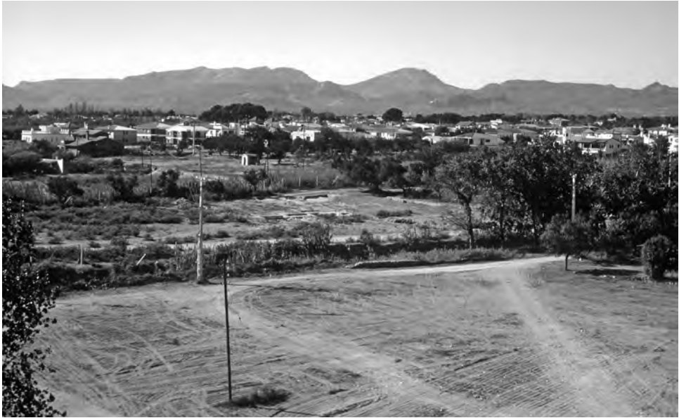
Fig. 1. Vista general de l'àrea arqueològica el 1983 (J. Massó).