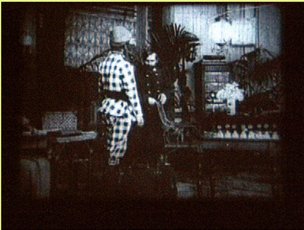
Fragment d'un film de Segundo de Chomón