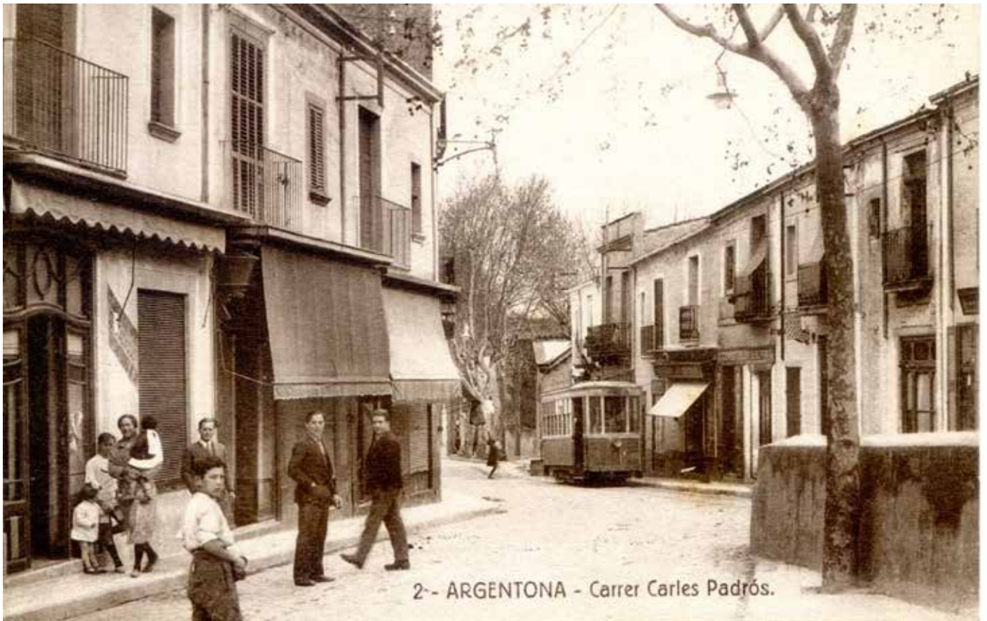
El carrer Gran amb el tramvia (1930). Postal Casabella. Arxiu Enric Subià