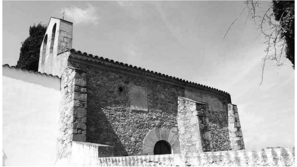
Ermita de Sant Miquel de Mata (Mataró).

Després hi va haver tota una sèrie de reunions a fi d'anar tre-